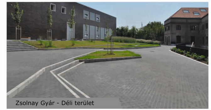
Zsolnay Gyár - Déli terület