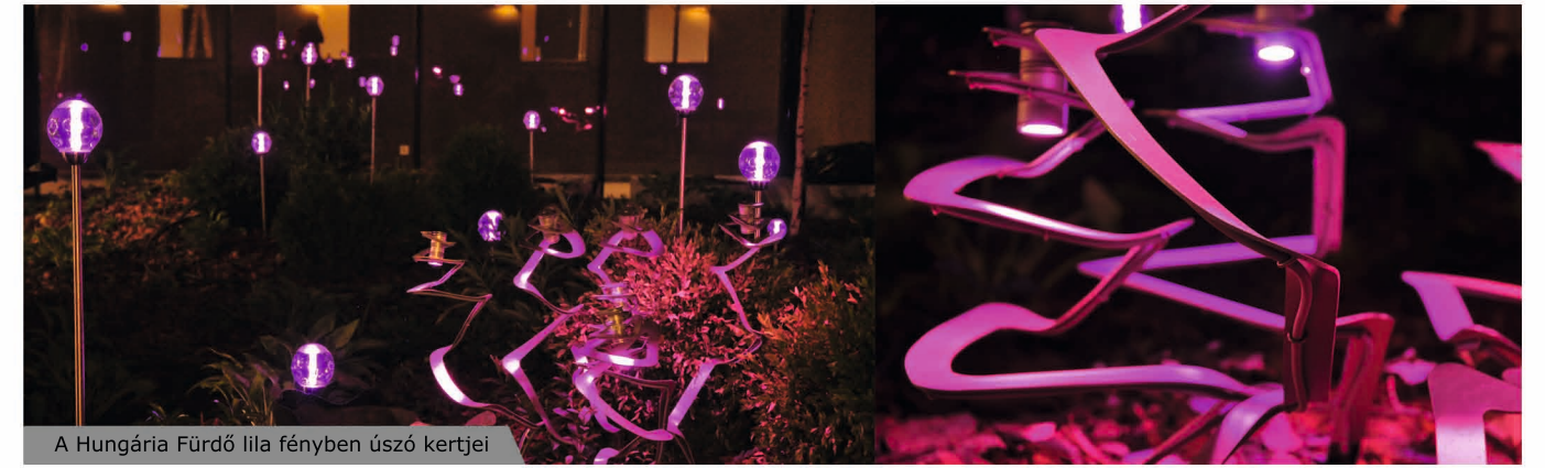
A Hungária Fürdő lila fényben úszó kertjei

The works developed by our group try to answer questions raised by the given time and space, which gives strong conceptual basis for each work and sets ground for the landscape design. The works presented show that with the means of landscape architecture magical places can be devised, the base for livability can be set and embeddedness can be helped to arise. The works try to underpin the belief that landscape architecture can be of help in creating an open, inclusive and cooperative society that takes active part in forming its' environment and future.