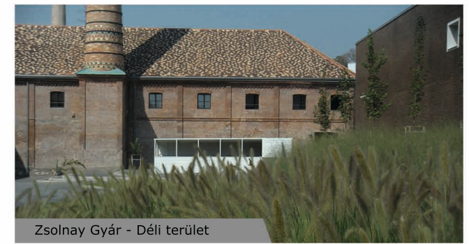
Zsolnay Gyár - Déli terület