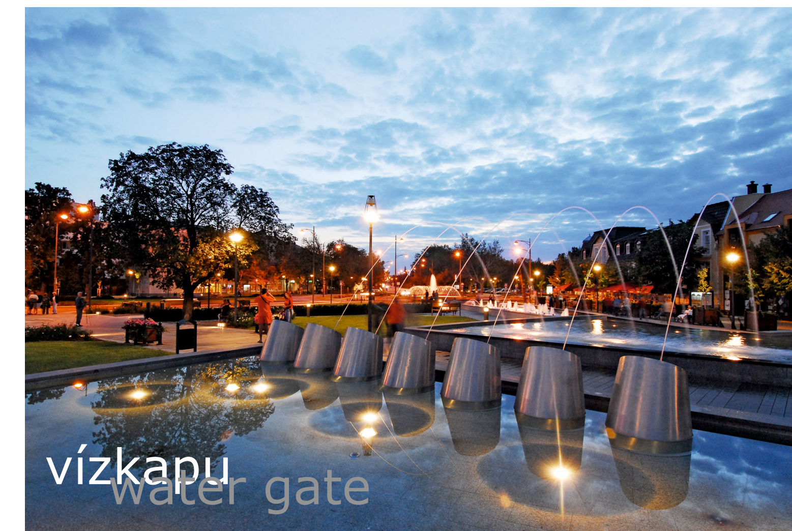
vízkapu water gate