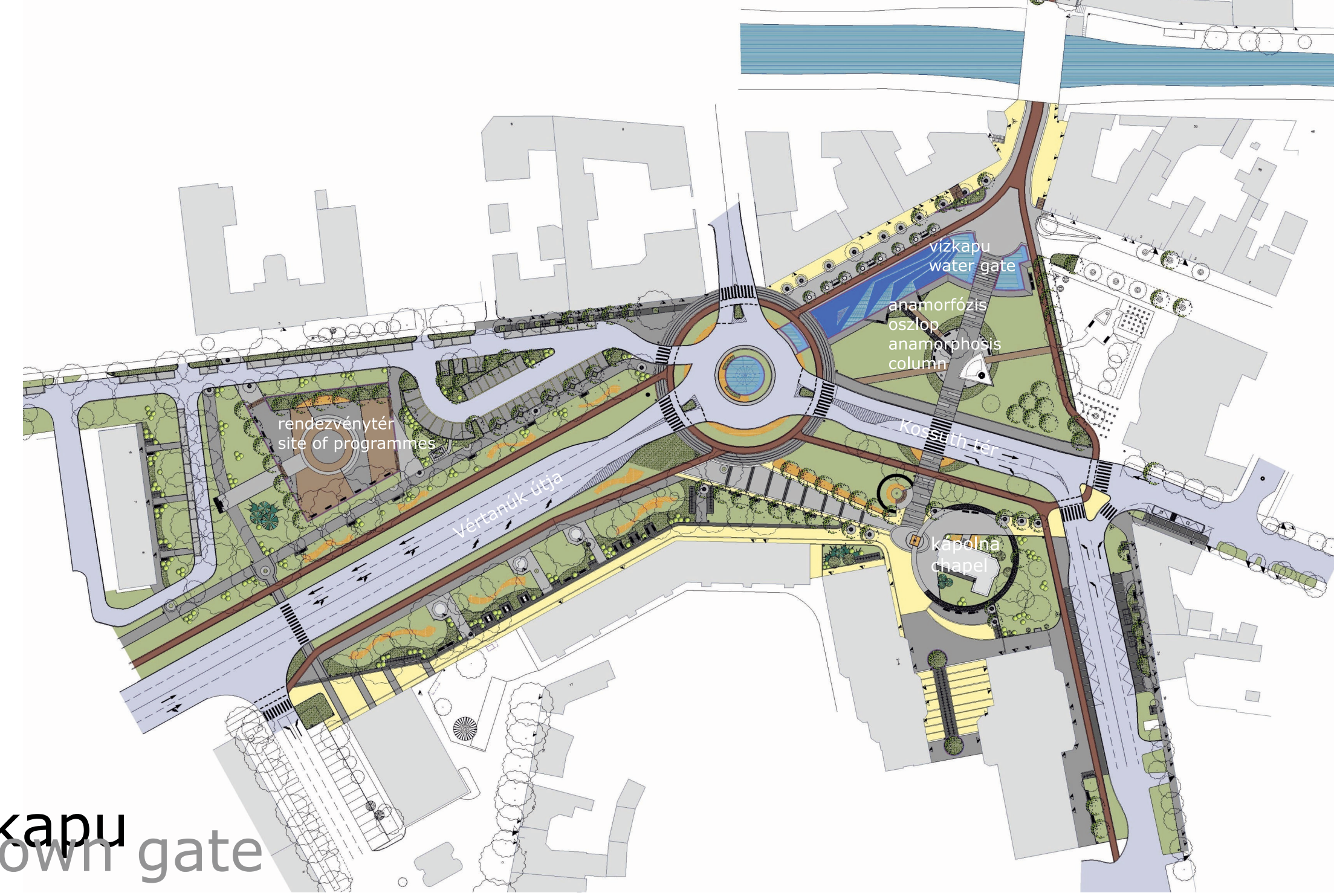
új városkapu new town gate