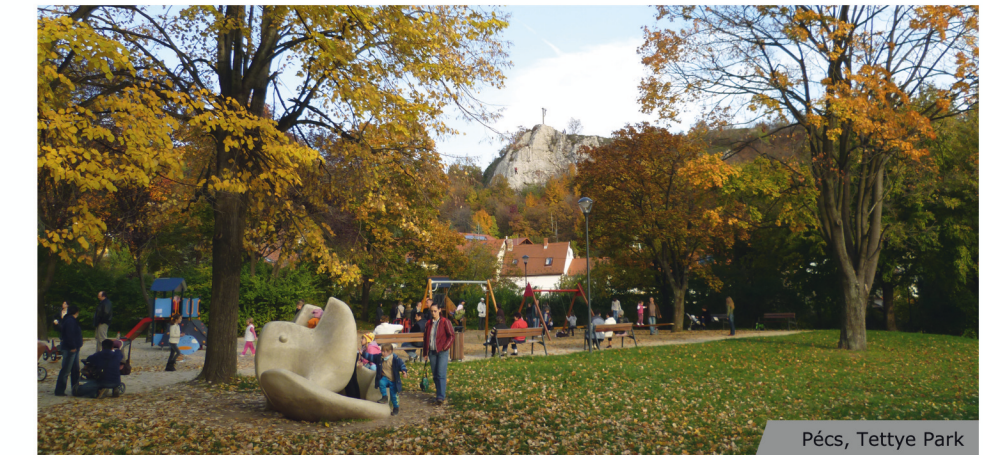
Pécs, Tetteye Park