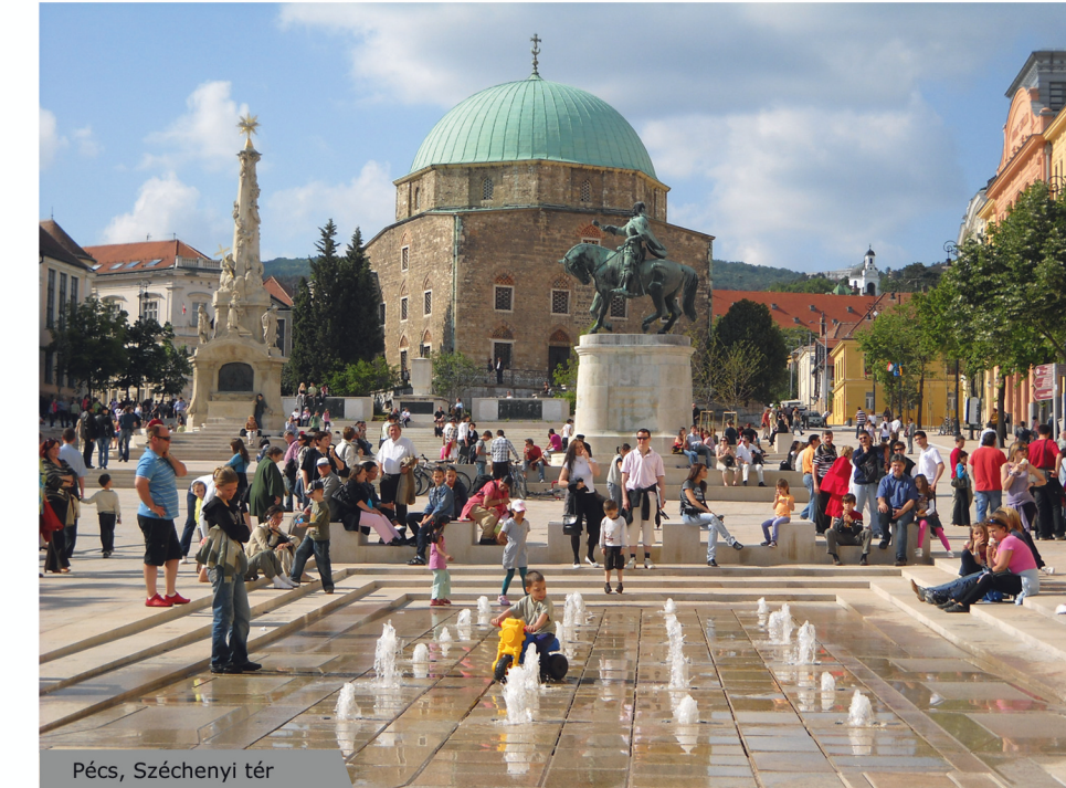
Pécs, Széchenyi tér

When entering for the "Prize of Landscape Architect of the Year" we, as general designers, present the three most important projects of ours from the last five years. They feature the competition-winning project, the plans of the state's main square (Kossuth sq., Budapest, 2007-09); the main square of the European Capital of Culture 2010 (Széchenyi sq., Pécs, 2008-10); and one of the biggest cohesive public and green area renewal in Central Europe (Tetteye, Pécs, 2008-11).