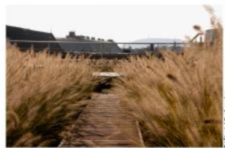
Tető kert / Roof garden