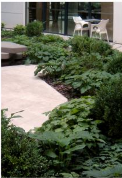
Restoráció / Garden of the restaurant