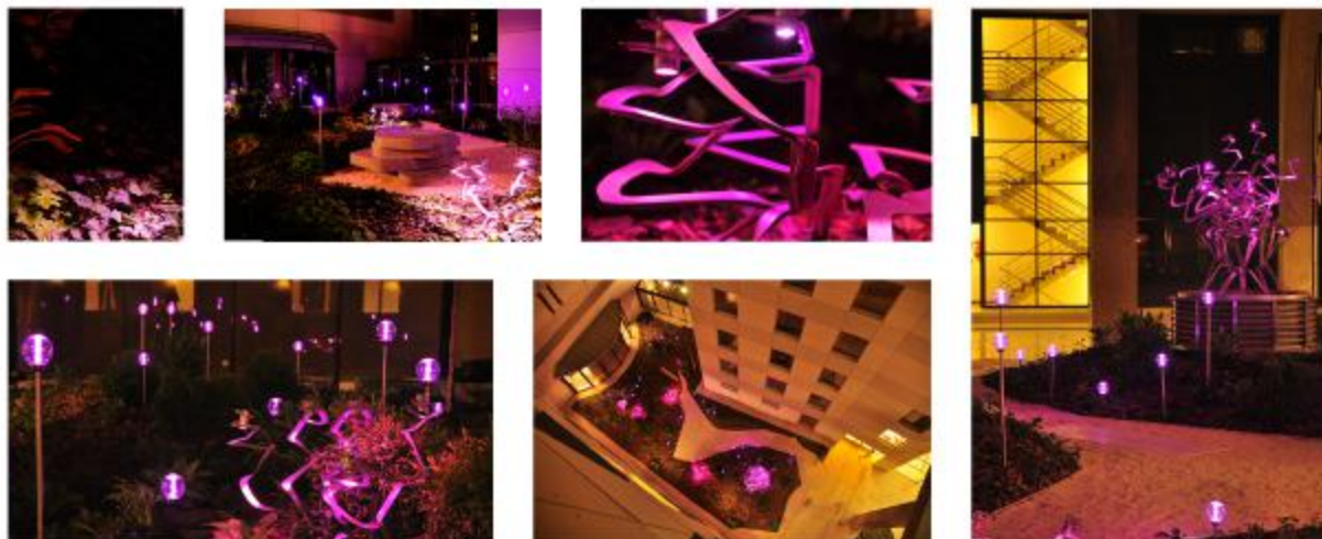
A mesebeli, szagok és színek. A fiktív fa és a lila fények szórja a kertbe.

Az egykori Hungária fürdő (most Zara Hotel) ármánykos belső kertje a kialakított sűrű ármánykos növénykiültetésnek köszönhetően egy erdei tisztás hangulatát idézi. A kert éjszaka egy elvarázsolt erdő képét festi, ahol különféle mesterséges formációk, lények elevenednek meg, az éjszakai világítás segítségével. A kert súlypontjában éjszaka lilás fényben úszó úgymond mesefa áll, melynek sarjai a kert egyéb területein is előtörnek a talajtakaró növények közül. Mellette apró szentjánosbogarak lépezését idéző egyedi gyártású lámpák erősítik a kert mesészerűségét. Az alap elgondolás lényege, hogy a megszokott előre gyártott lámpák helyett egyedi kialakítású, a kert koncepciójából fakadó, úgymond „világító szobrok” biztosítsák a kert megvilágítását, melyek a kert díszel is egyben. Különös fontossággal bír ez a gondolat, mely az egyedileg gyártott, művészi elemek és az tájépítészeti szoros összességét tűzi ki célul, mely a Hungária fürdőhöz kapcsolódva a szecesszió korát idézi meg gondolati értelemben. A tetőterazon, mely a wellness teréhez kapcsolódik, homogén díszű növénykiültetés képezi a pesti betők előterét. Fények: Terbesy Tóbiás - Medence csoport