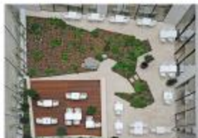
Restoráció / Garden of the restaurant