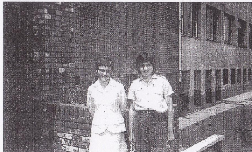
Szárnybontogatás idején a matektanár és a tanítvány (is)