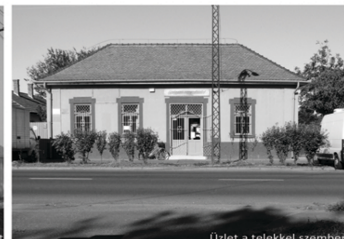
Útlet a telekkel szemben