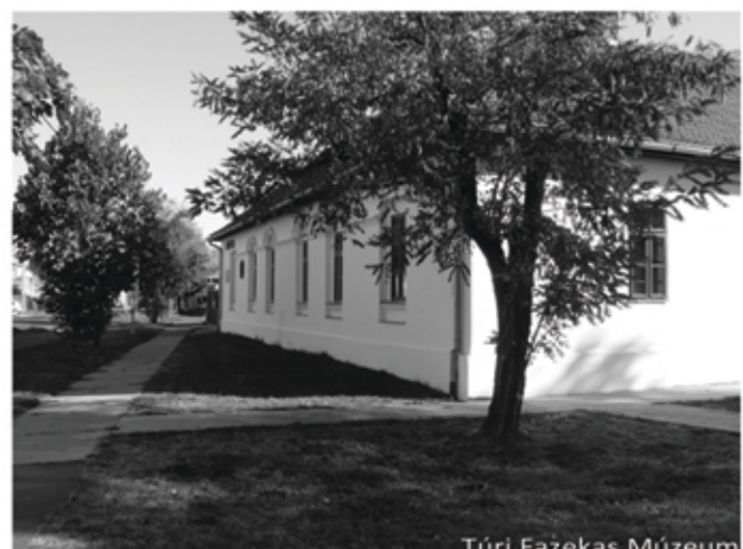
Túri Fazekas Múzeum