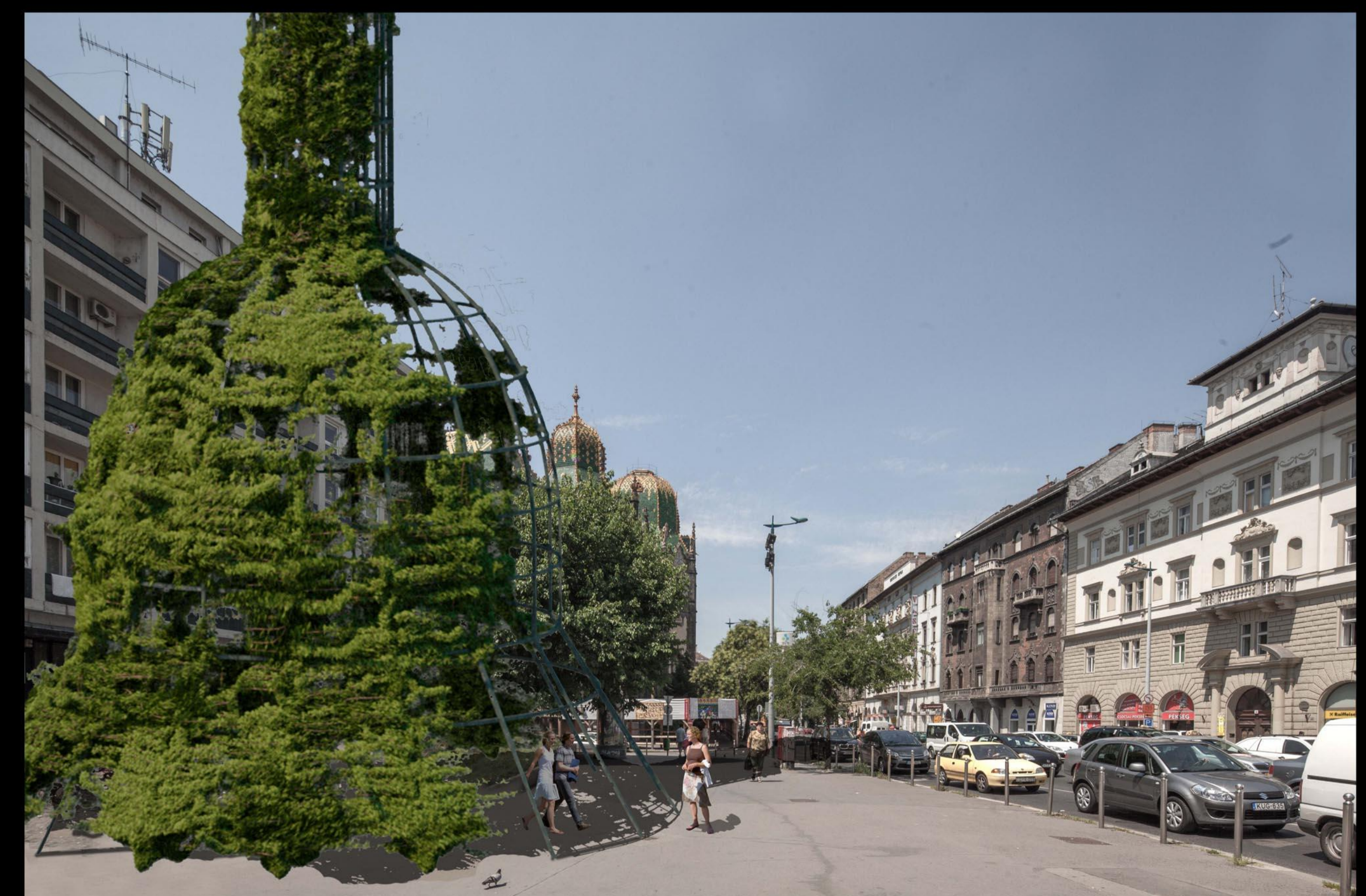
A Lechner lugas