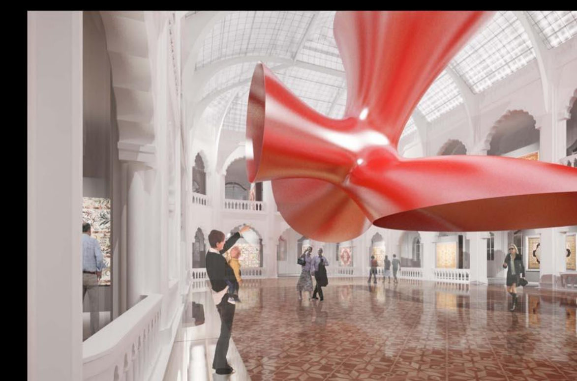
Az aula, mint installációs tér