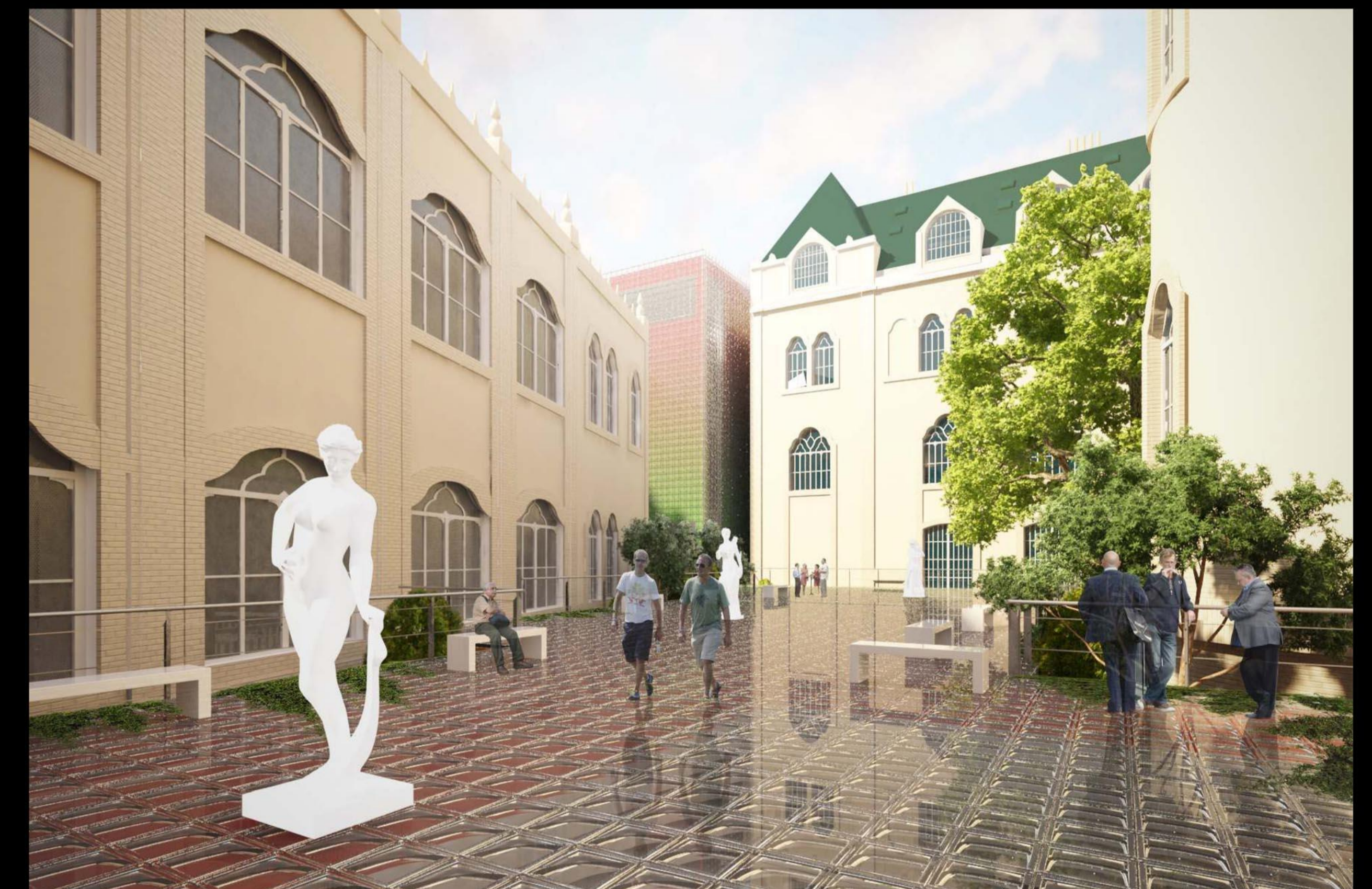
Az udvar képe, háttérben az új beépítéssel