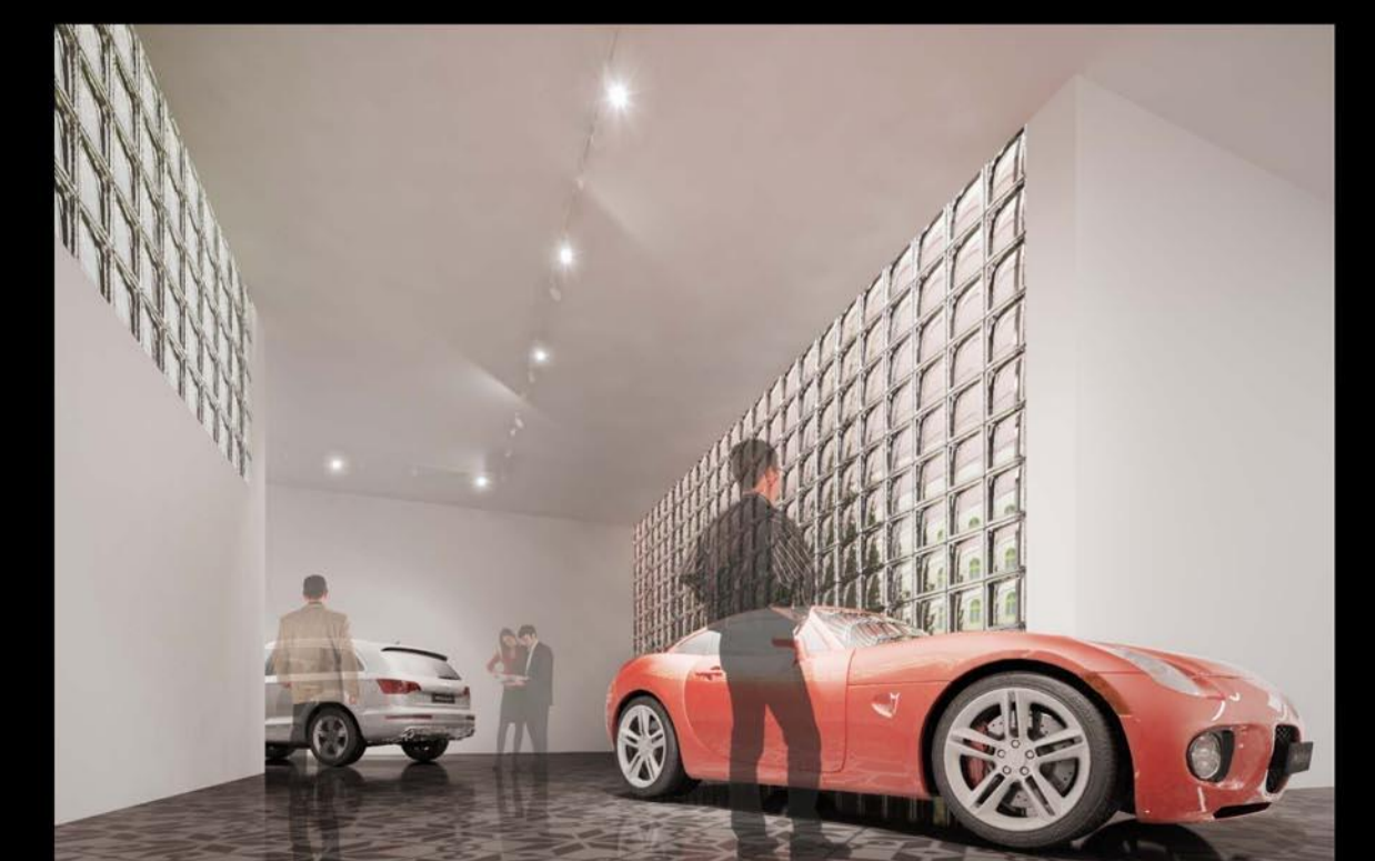
Az udvar alatti időszakos kiállítások tere