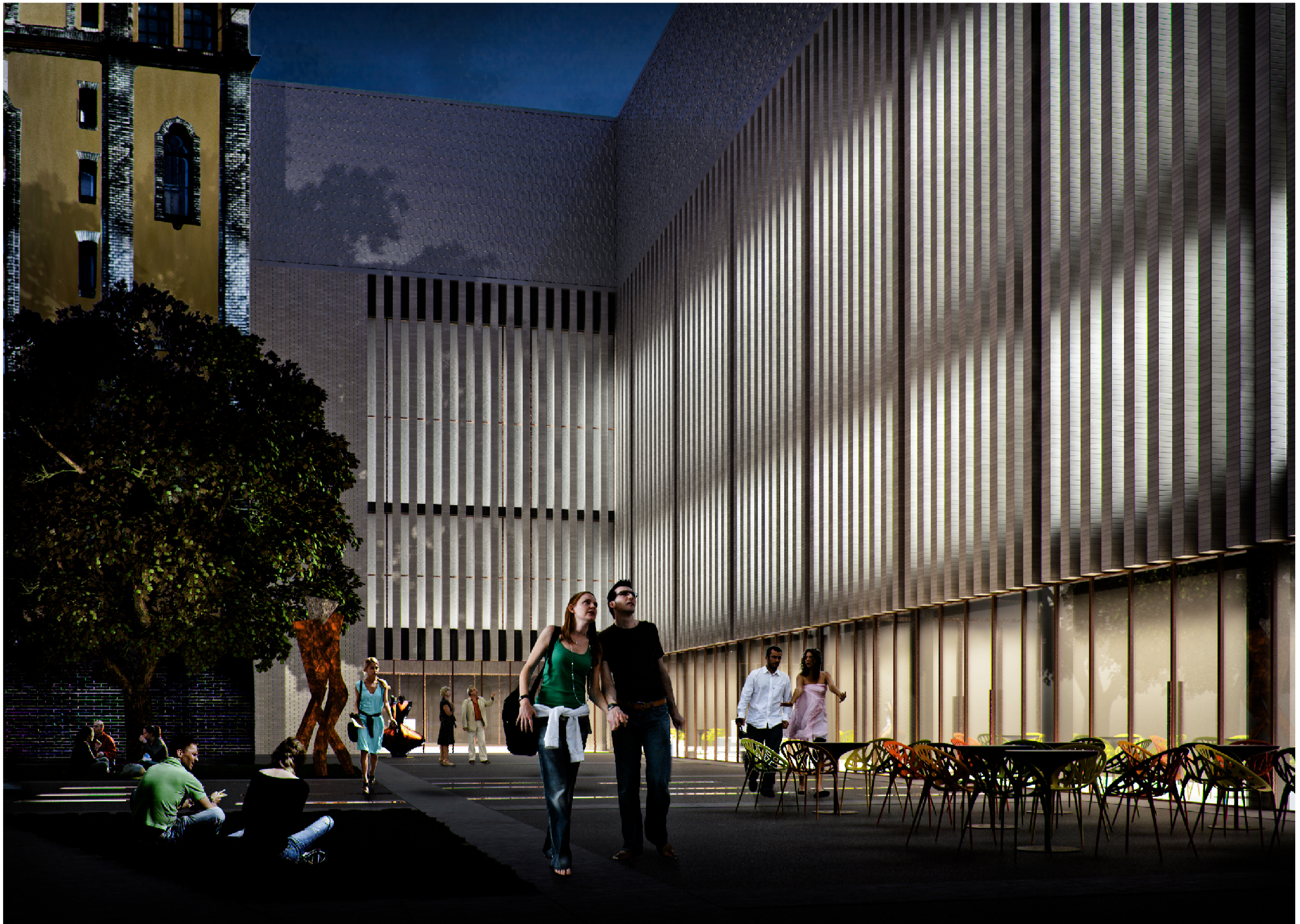
ÚJ ÉPÜLET - BELSŐ UDVAR FELŐL