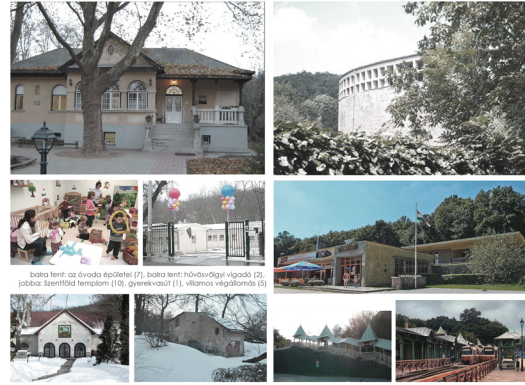
balra fent: az óvoda épülete (7), balra lent: hűvösvölgyi vígadó (2), jobbra fent: szentföld templom (10), gyermekvasút (1), villamos végállomás (5)