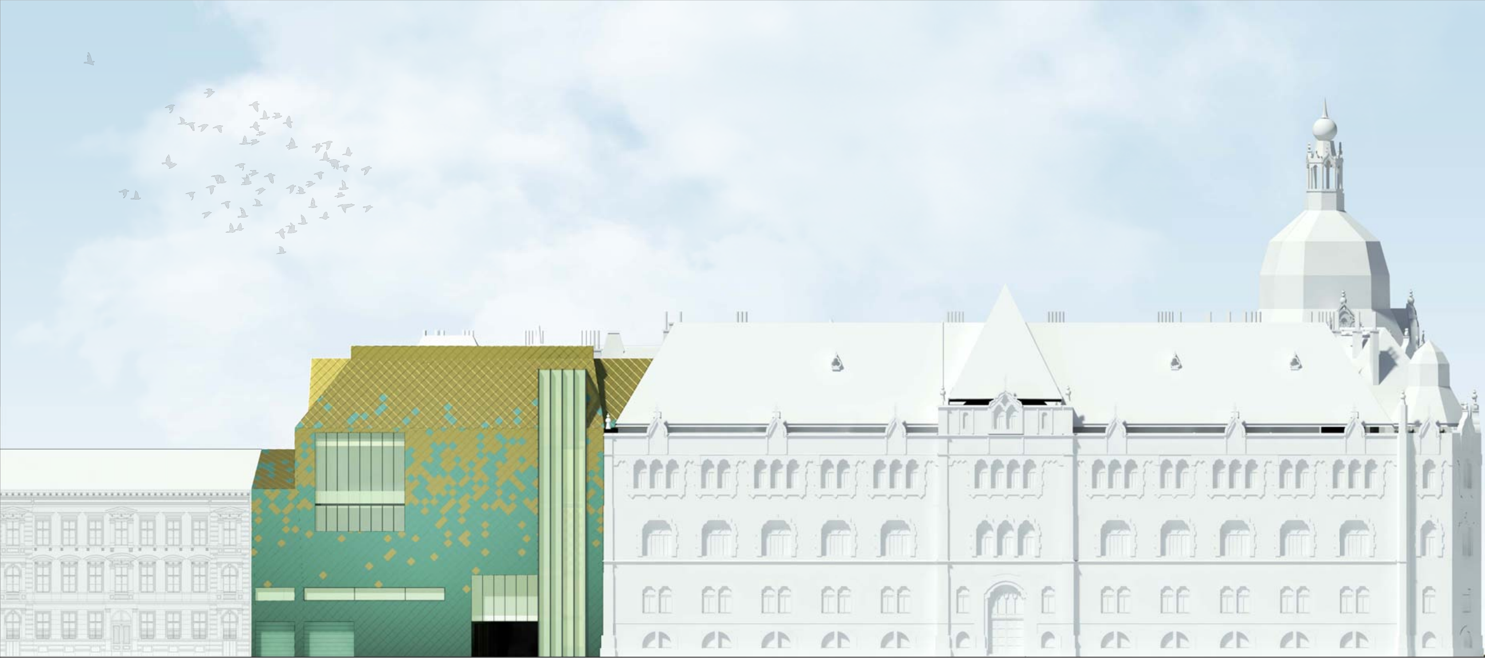
Homlokzat 1=200 ⤴