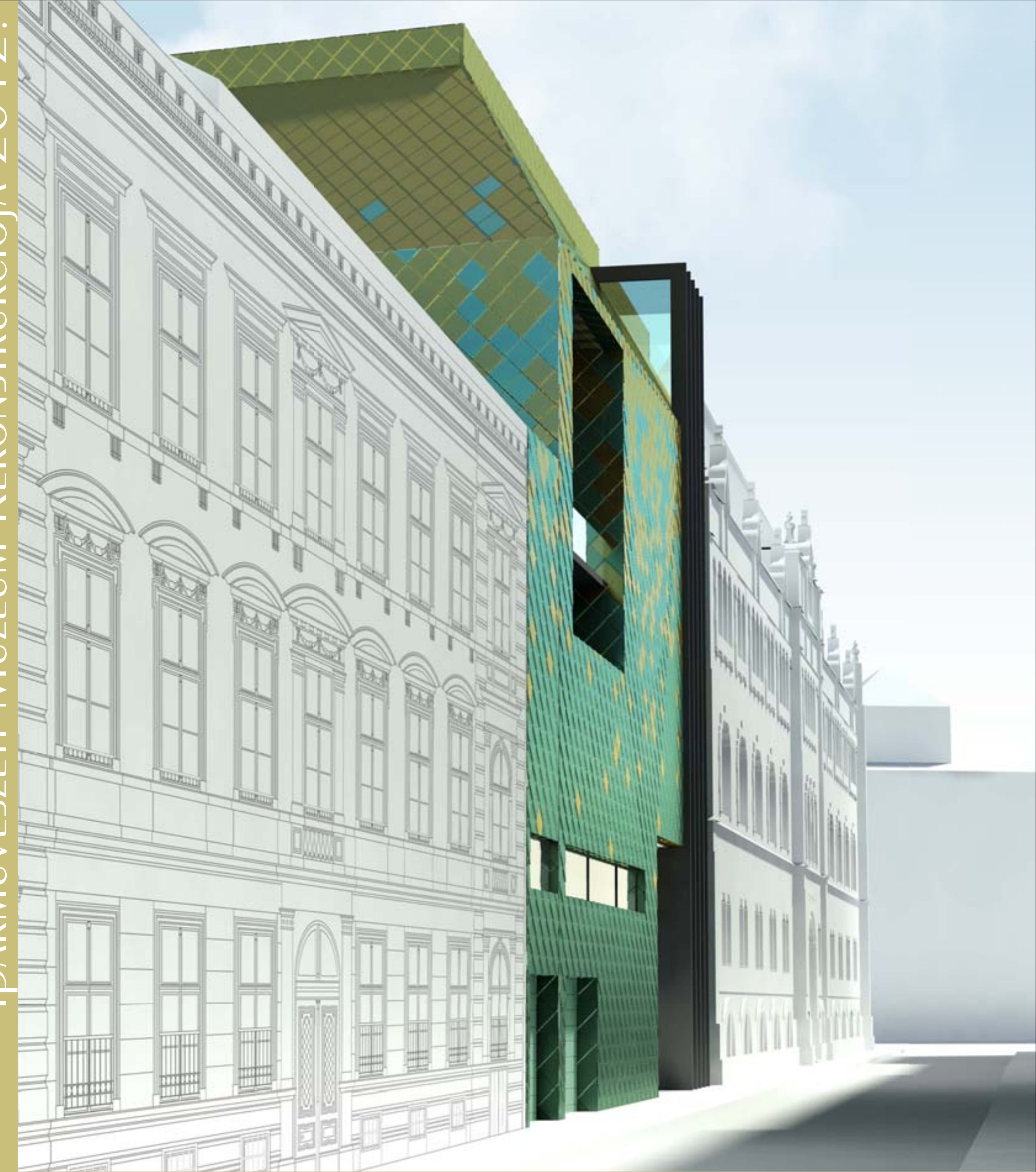
Hőgyes Endre utcai látvány

IPARMŰVÉSZETI MŰZEUM REKONSTRUKCIÓJA 2012.