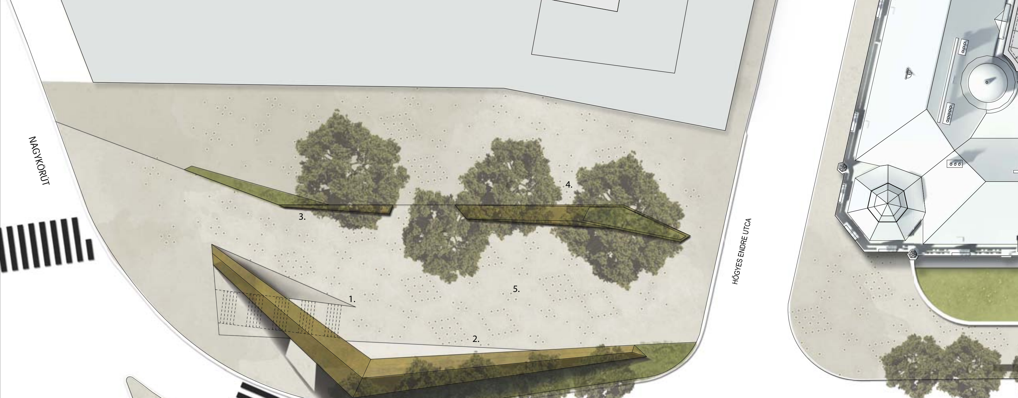
1. A Múzeumba vizuálisan rávezető átírt lépcső az aljáról 2. Korábbi képzőművészeti alkotás „KAPU” 3. Ülőpadok 4. Zöld növényzet 5. Rombusz alakzatban elhelyezett led-es világítás a burkolatban