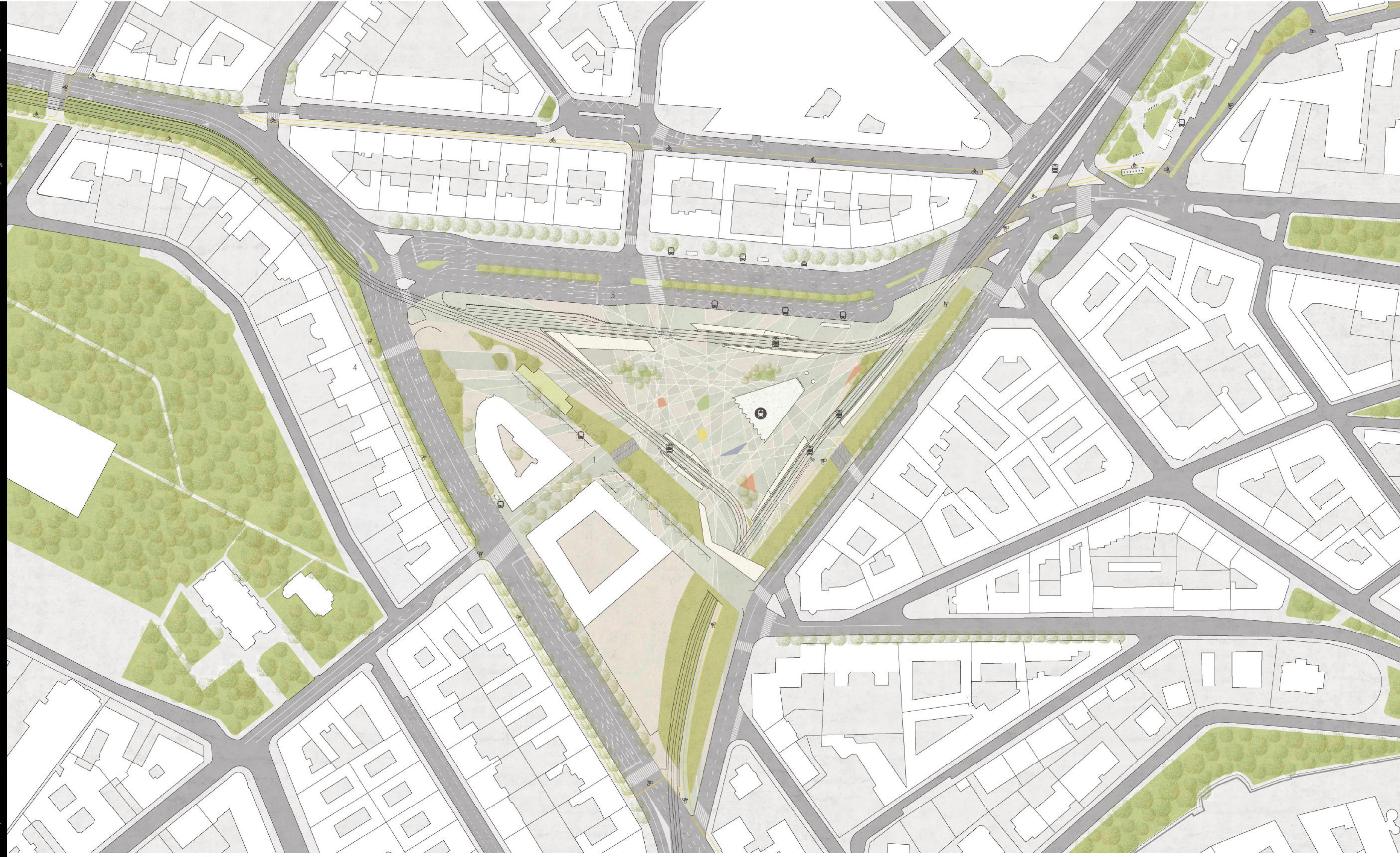
1 II. ütem - Csaba utcai gyalogos aluljáró

A minőség egy állomás nem volt, de a városi tanács. A városi tanács, az a városi tanács. A városi tanács, az a városi tanács. A városi tanács, az a városi tanács. A városi tanács, az a városi tanács. A városi tanács, az a városi tanács. A városi tanács, az a városi tanács.