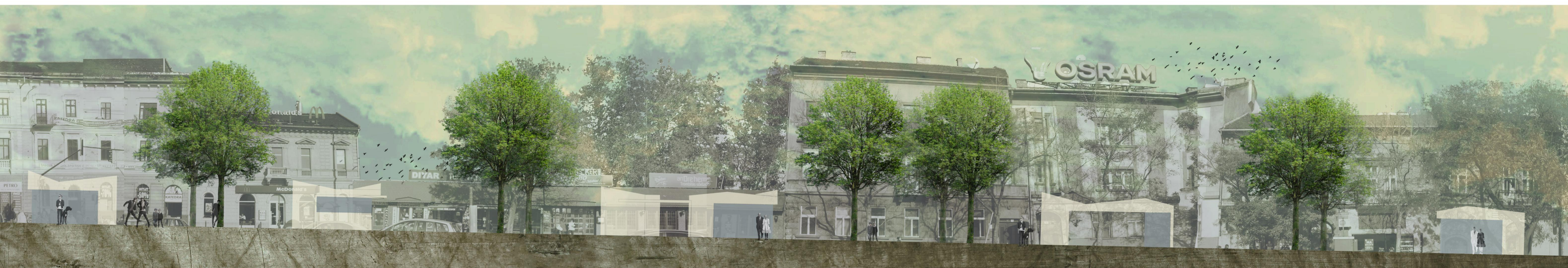
3.2. A-A METSZET M 1:200