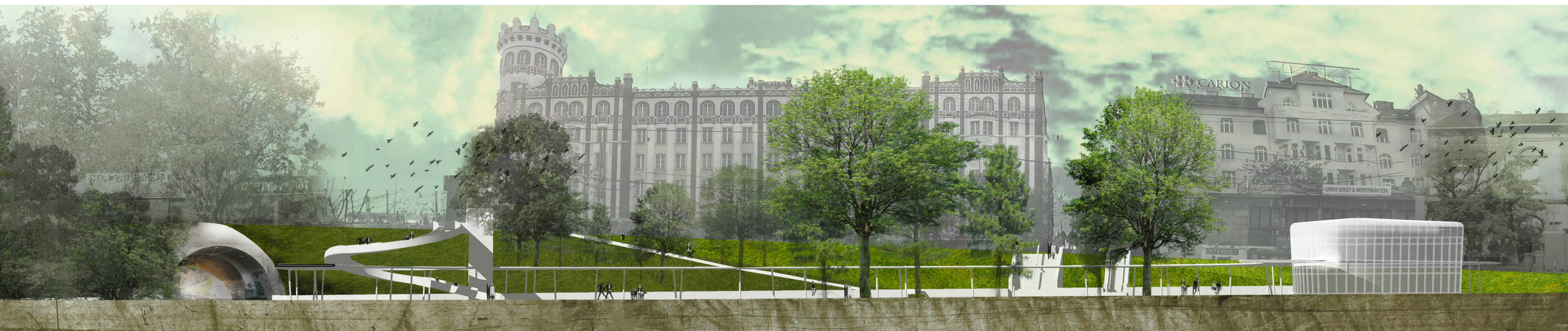
3.4. C-C TÉRMETSZET M 1:200