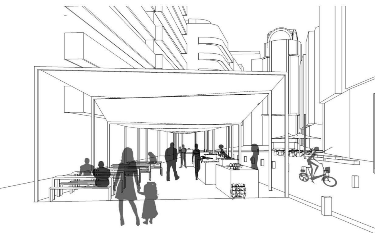
ZSIDÓ NYÁRI FESZTIVÁL