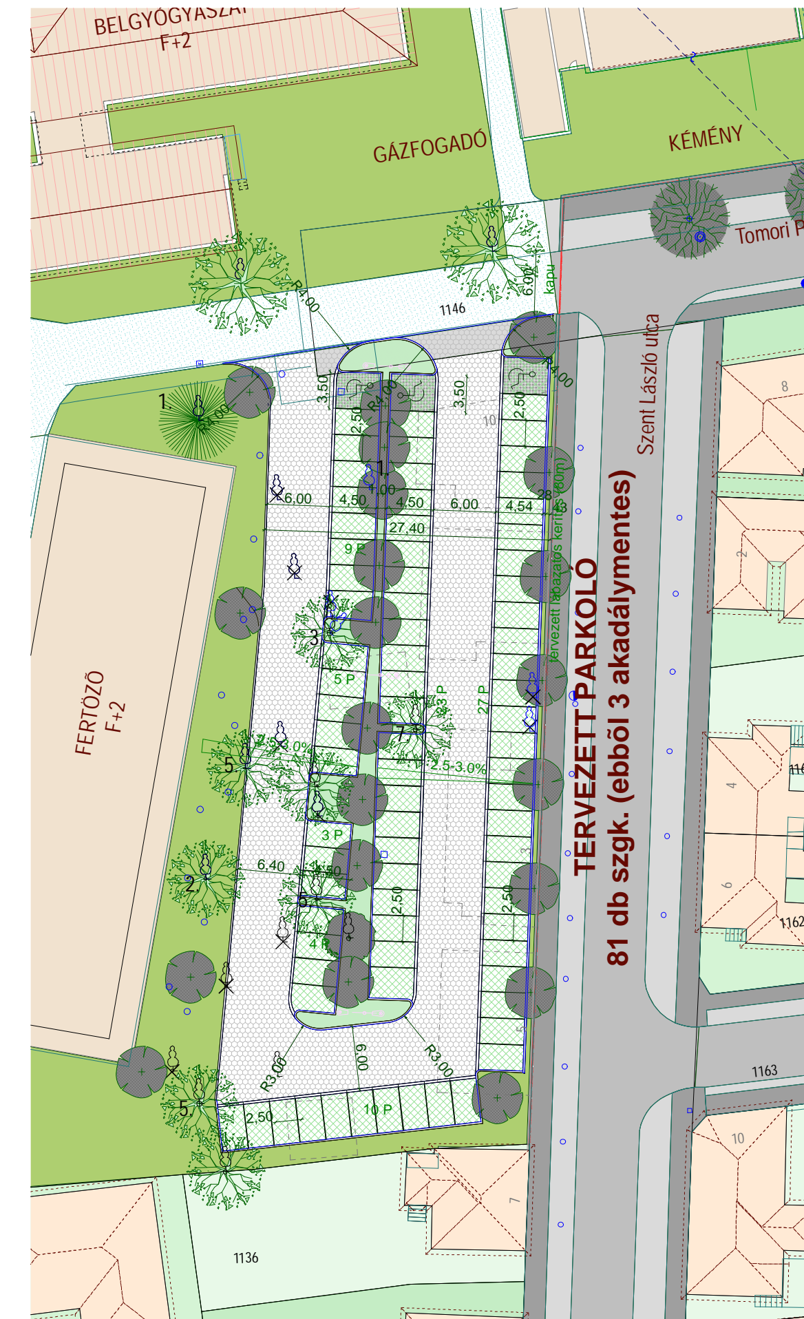
SZENT LÁSZLÓ UTCAI PARKOLÓ PARKOSÍTÁSI HELYSZÍNRAJZ M 1:500