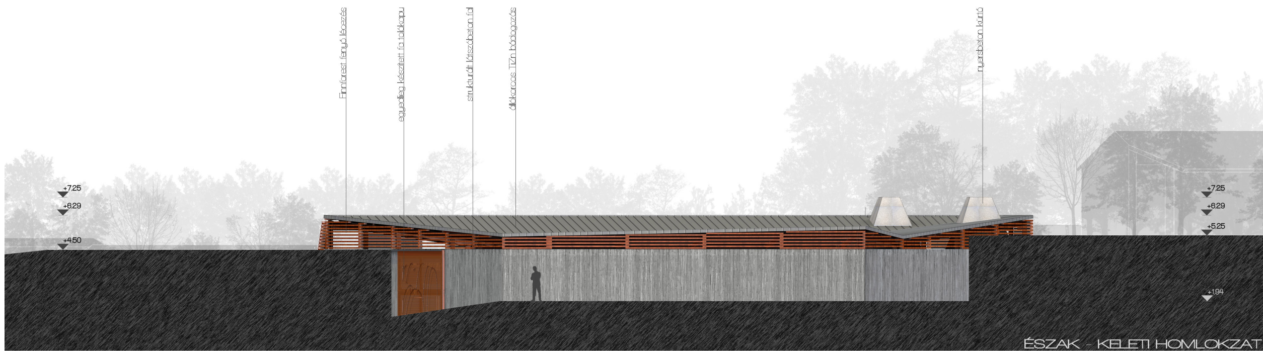
ÉSZAK - KELETI HOMLOKZAT