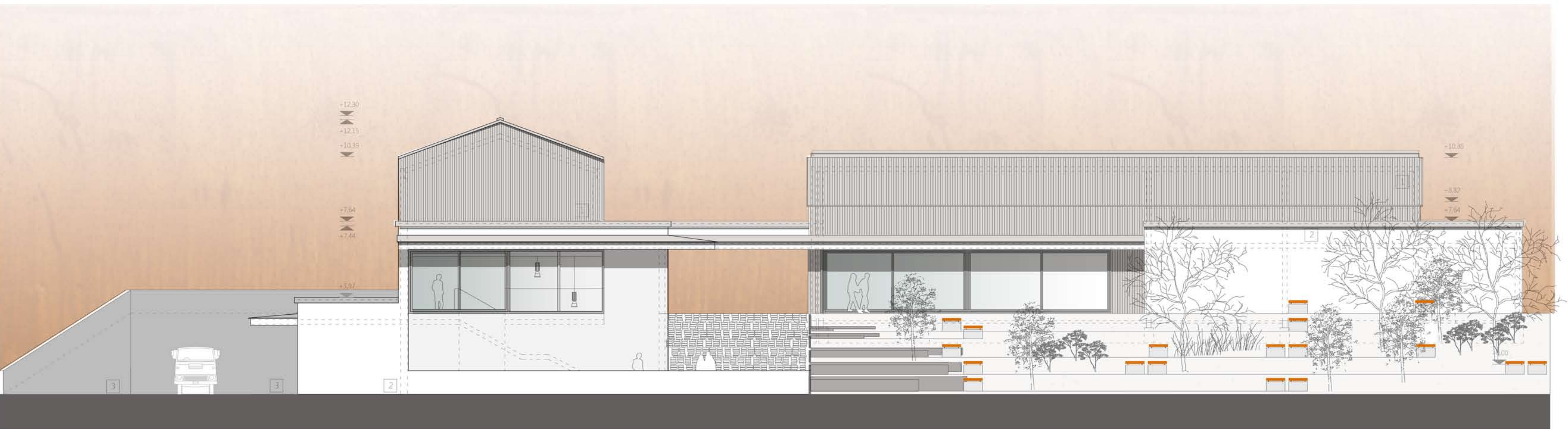
H2 homlokzat - balatoni oldal