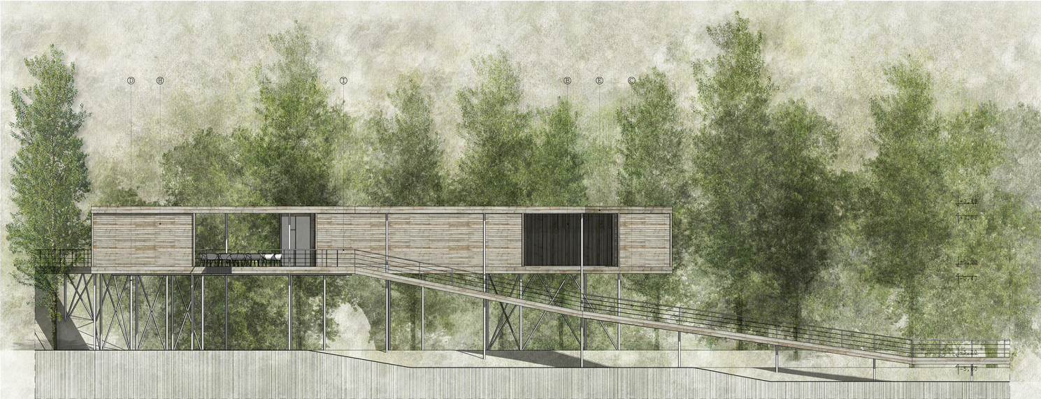
északi homlokzat M=1:100