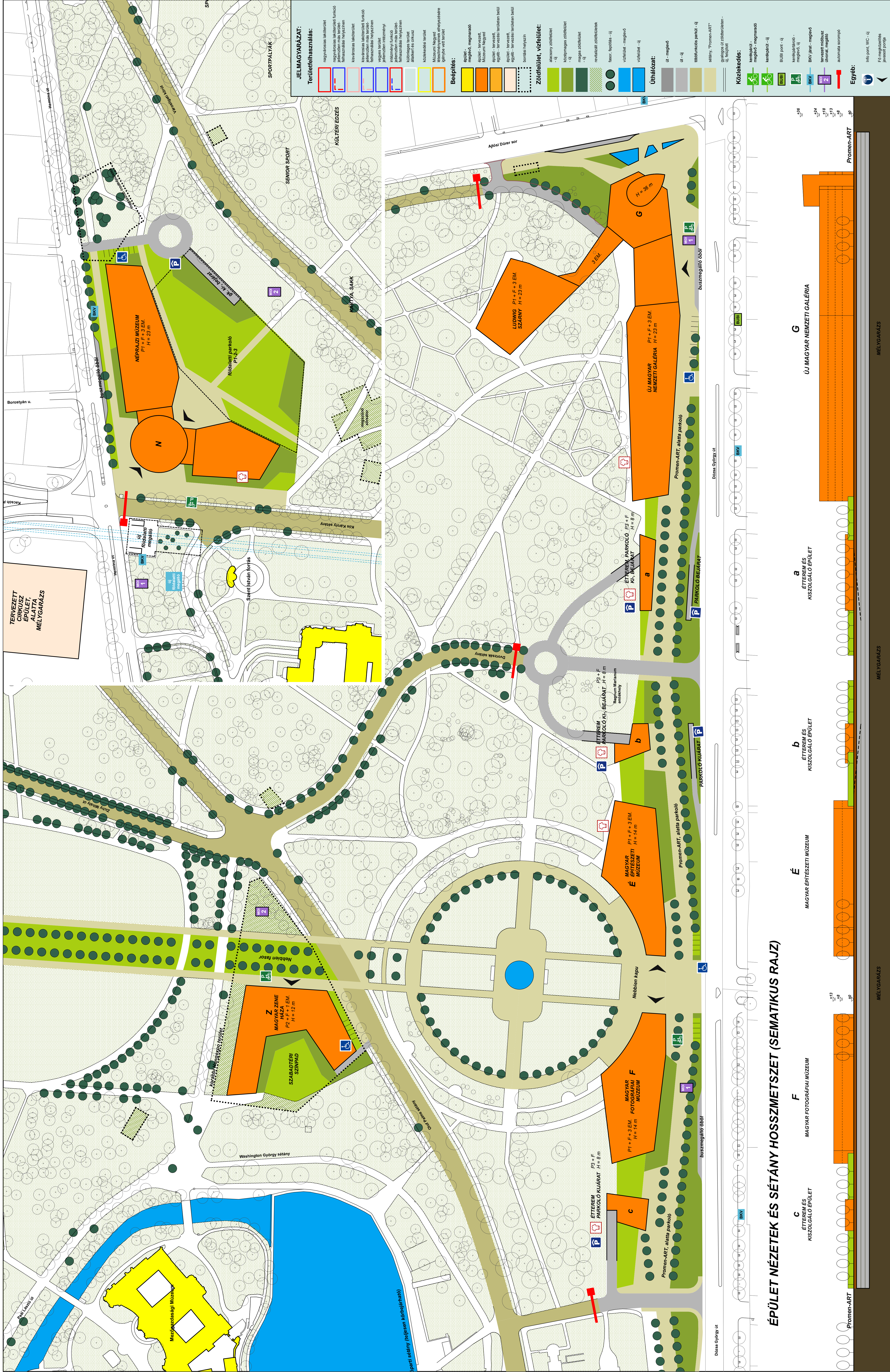
ÉPÜLET NÉZETEK ÉS SÉTÁNY HOSSZMETSZET (SEMATIKUS RAJZ)