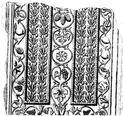
sírkő növényi ornamentikával

A tervezett bővítés homlokzati díszítésében finom növényornamentika jelenik meg, mely a zsinagógának, a zsidó kultúrának egy finom megidézése tud lenni.