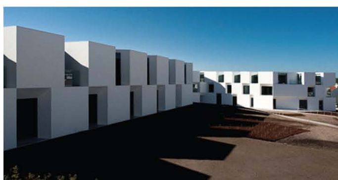
IDŐSEK OTTHONA AIRES MATEUS ARQUITECTOS 2011, PORTUGÁLIA