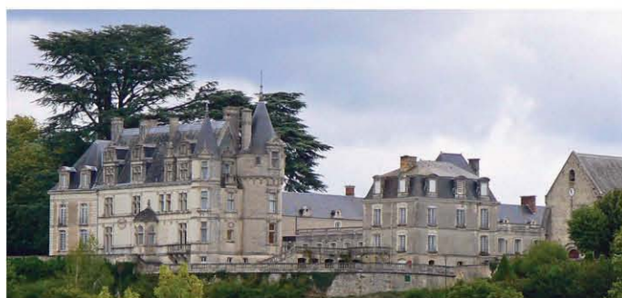
IDŐSEK OTTHONA RÉGI ÉPÜLET HASZNÁLATA CHATEAUVIEUX, FRANCIAORSZÁG