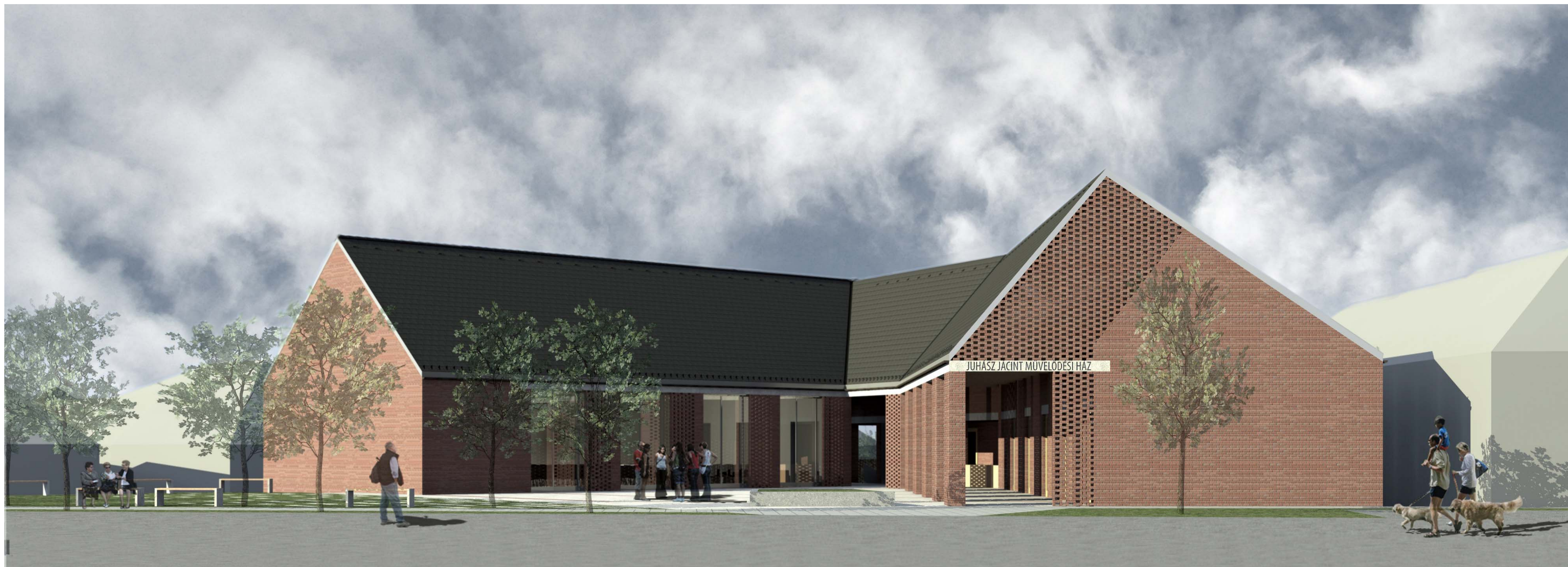
Perspektíva a Fóti út felől