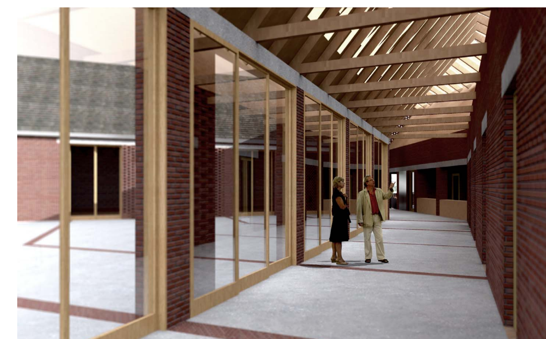
Perspektíva a tornácról télen