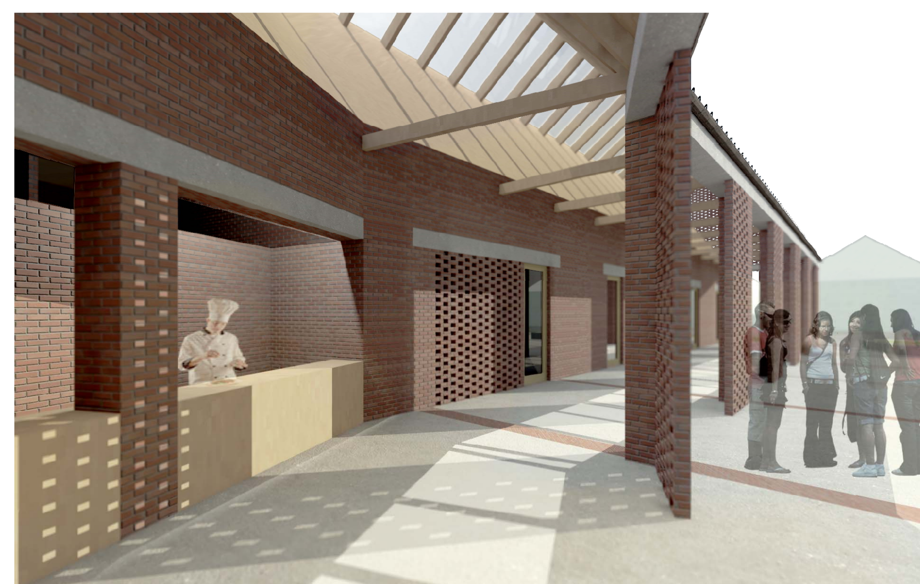
Perspektíva a tornácról nyáron

Az épület méretrendje, az alkalmazott feszítávok és szerkezeti megoldások (kis feszítávolságú monolit vasbeton födémek, hagyományos ácsolt fa fedélszékek, téglafalazat) lehetővé teszik a hagyományos építési mód használatát, egyszerűsítve ezzel a kivitelezés folyamatát. Mivel speciális technológiákra nincsen szükség, így helyi kivitelezők a saját meglévő erőforrásaikra támaszkodva képesek felépíteni a házat.