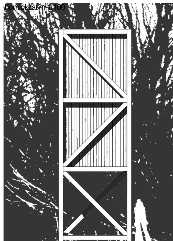
homlokzat m 1:100