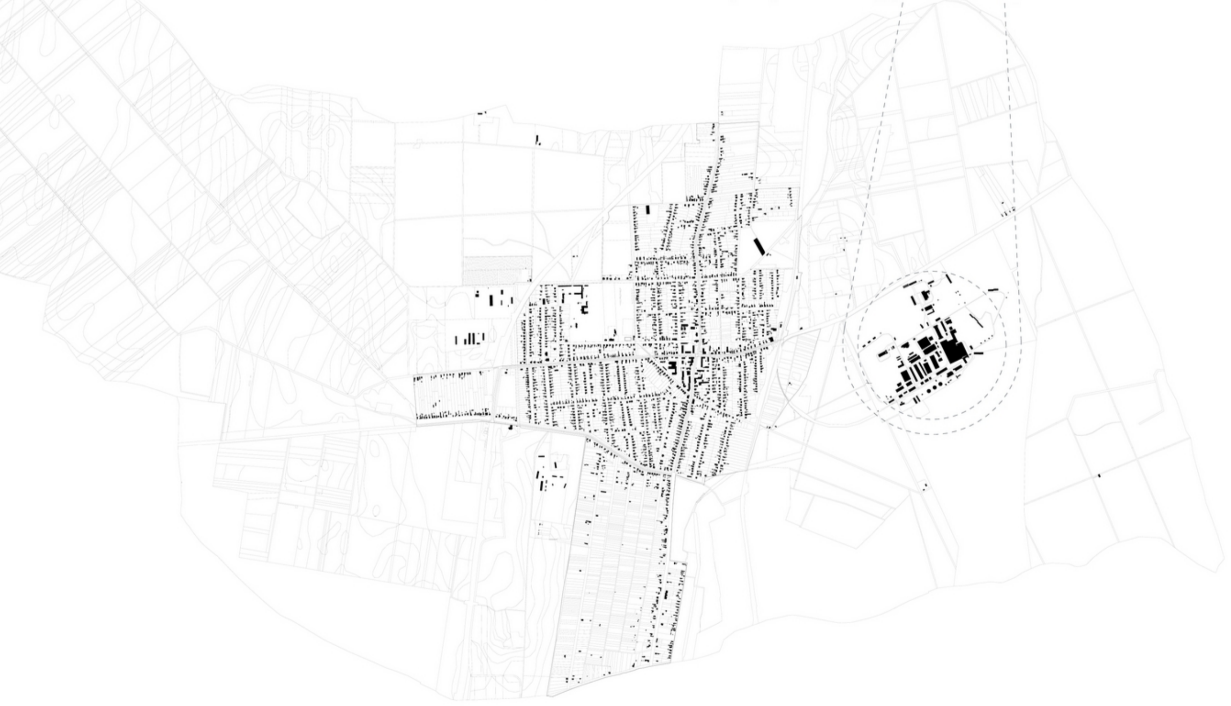
térkép m 1:20000