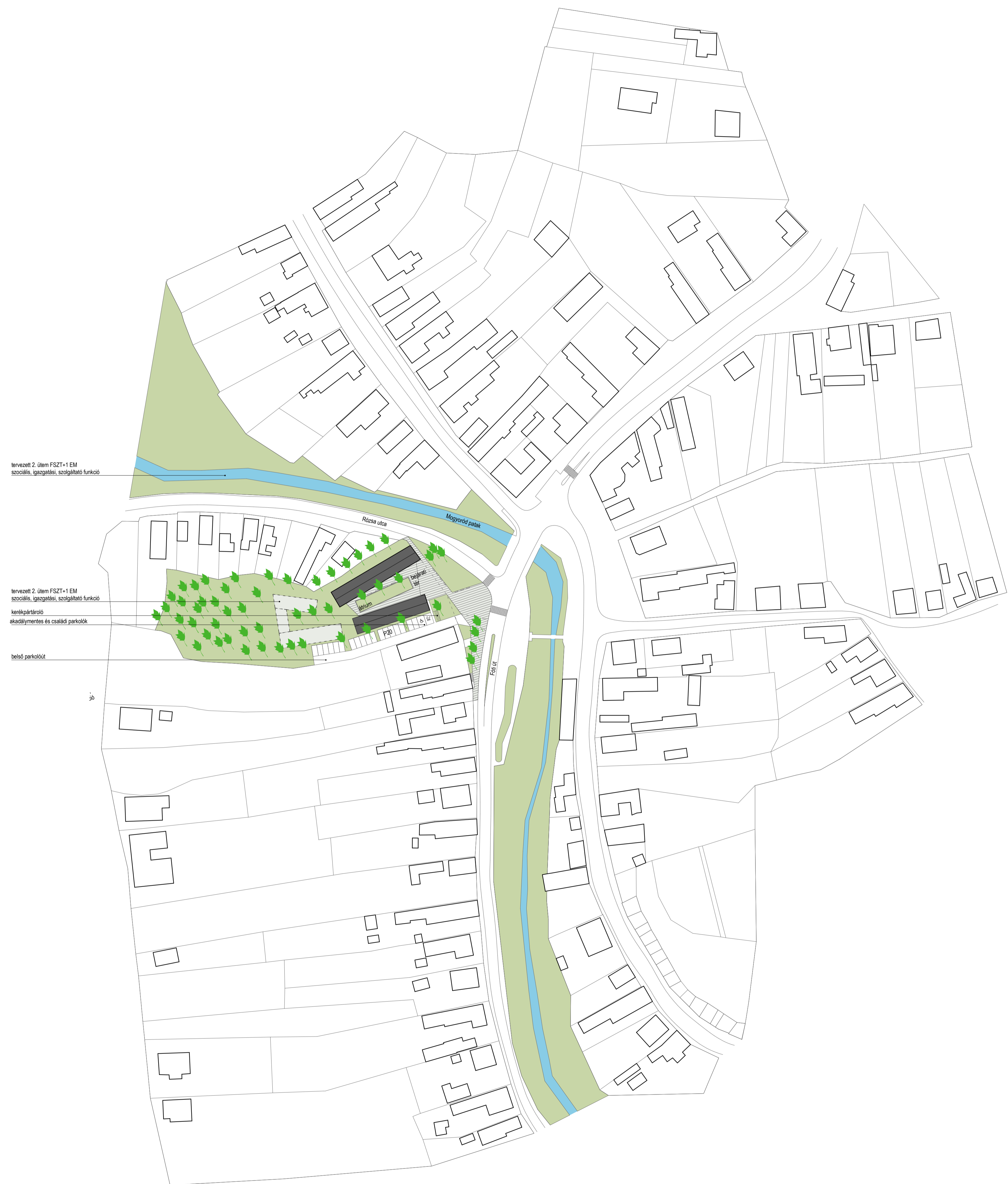
átnézeti helyszínrajz m 1:1000