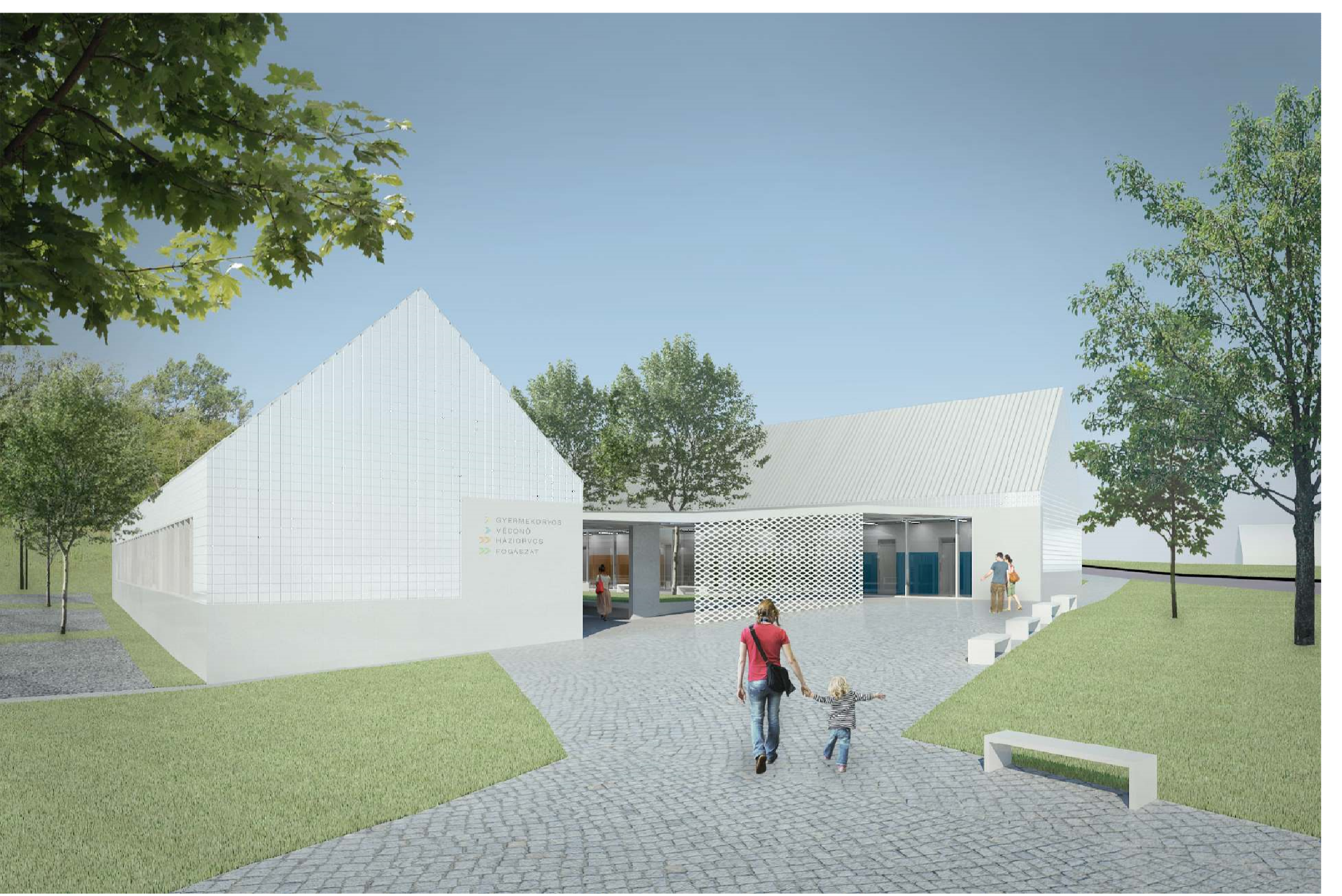
Látvány a Fő út felől