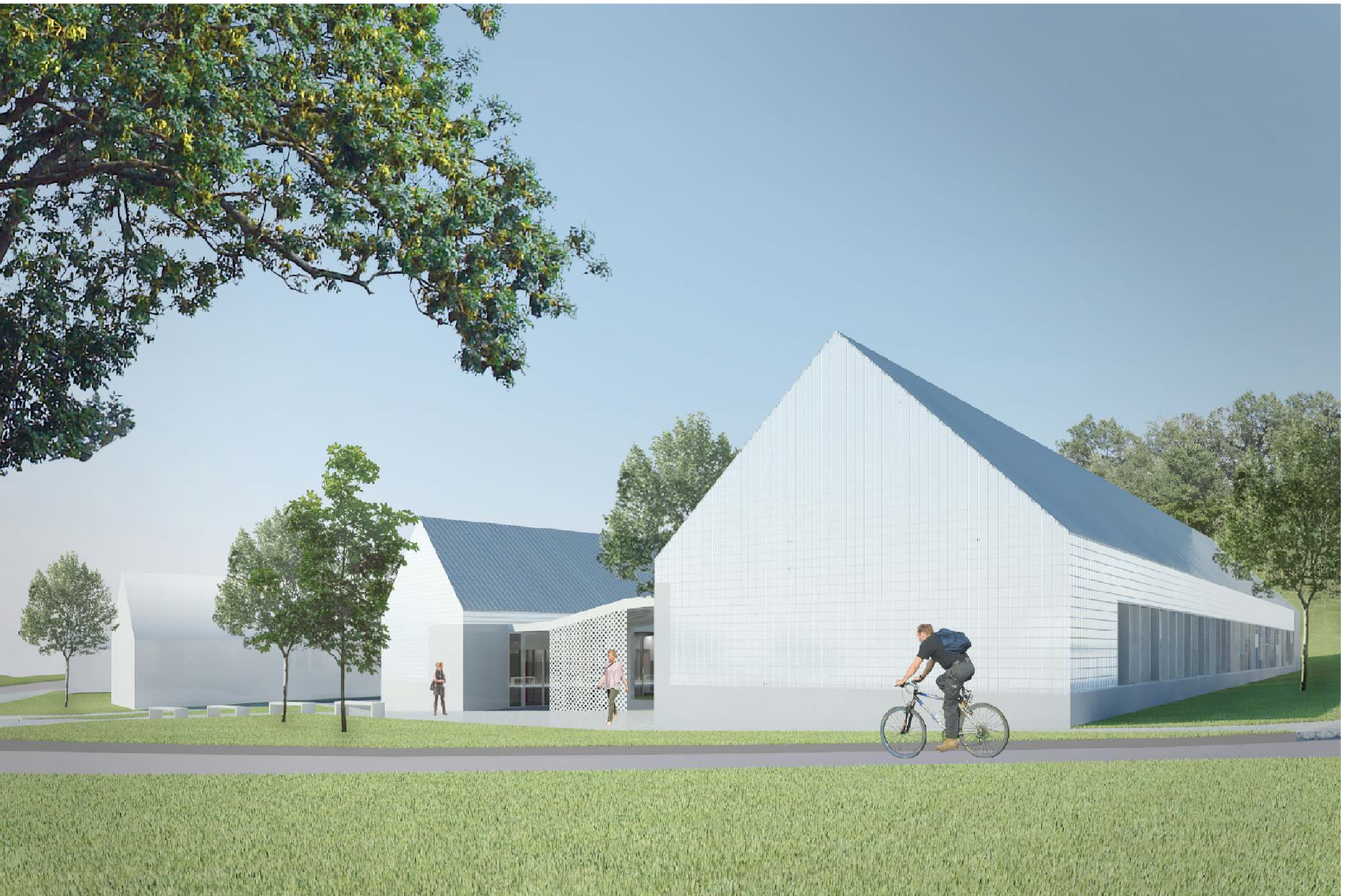
Látvány a Rózsa utca felől

KÜLSŐ - BELSŐ TEREK KAPCSOLATA A váróterek és a közös közös terek összekapcsolás. Ez a térrendszer fűt össze a két épületemeket. Összesen a külső és belső terek határát. BELSŐ UDVAR A növényekkel telepített és járószervekkel ellátott belső átlum és a körített levegő az orvosi várókat teszik kellemesebbé, ugyanakkor természetes fennnyel lépe el a várókat.