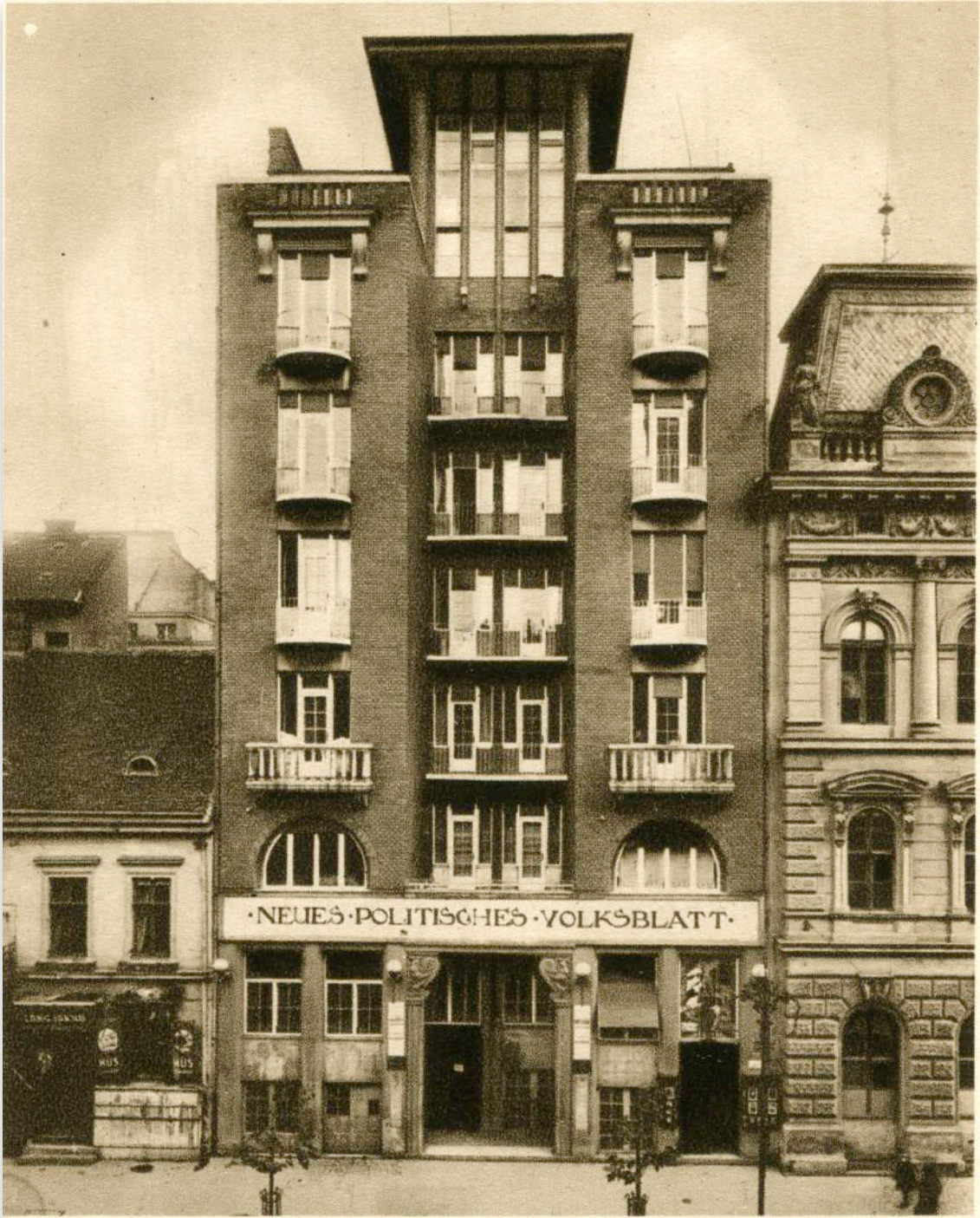
A frissen felépült épület homlokzata