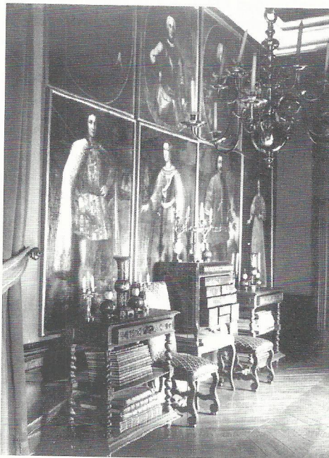
Ősök csarnoka, archiv kép (ÁMRK)

ban vörös stráfos kávézó, ma vörös szalon. Ezt követi 1639-ben a kápolna, 1796-ban nagy vörös szoba, ma nagy ebédlő. Sajnos a nagy átépítés eltüntette a kápolna maradványait, Lángi József nem bukkan a leírásokban jelzett falképekre. A sarok kabinetszobája rokokó stukkójával az enteriőrkiállítás része lesz. Mellette a „gerengő garádcson” lejuthatunk a kávéházba. A Nádor-terem előtt-