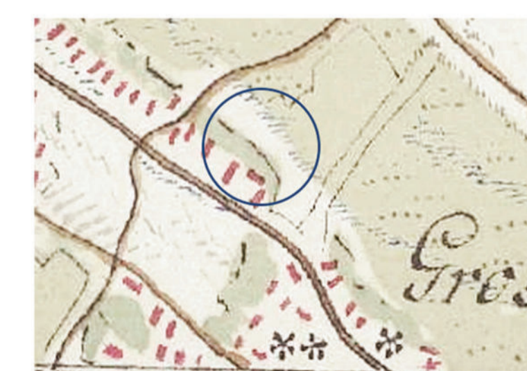
Az első katonai térképen még beépítetlen terület