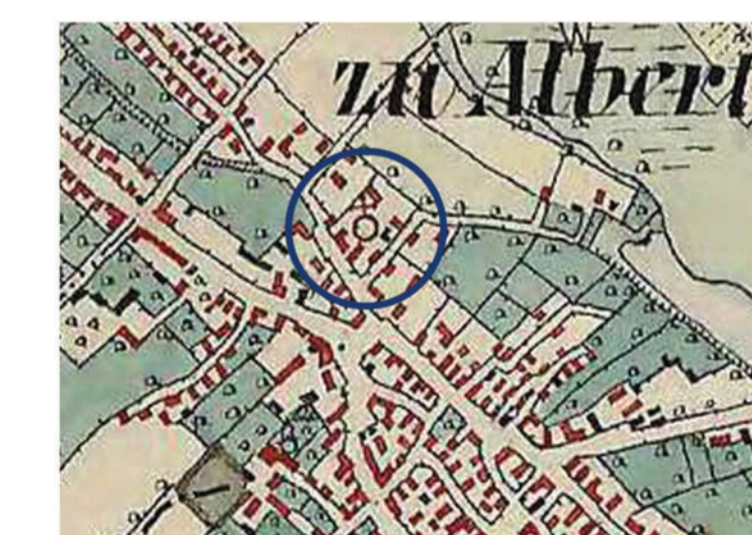
A harmadik katonai felmérés már feltételezhetően a település főleg zsidók lakta negyede veszi körbe a zsinagóga épületét