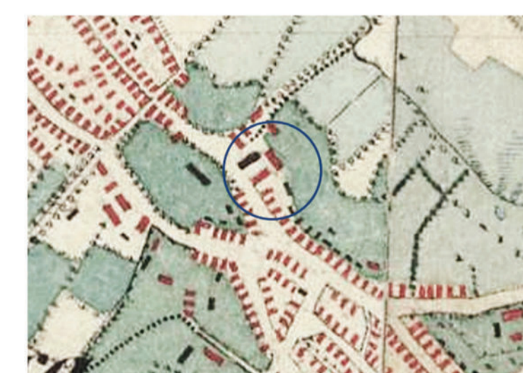
A második katonai felmérésen már elkezdnek beépülni a környező területek, a zsinagóga a térképen nem azonosítható