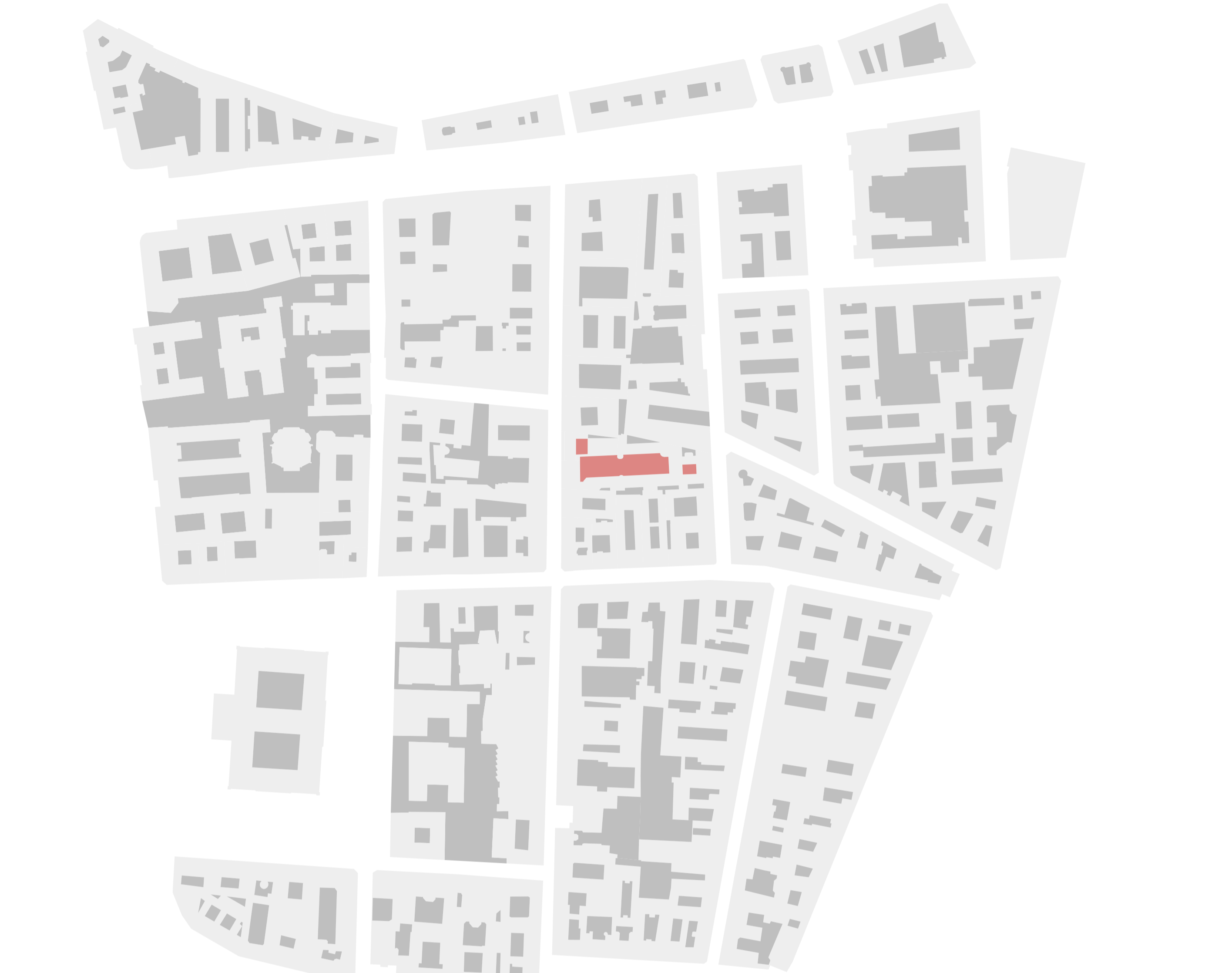
Helyszínrajz - udvarok M 1:2500

Parkolómérleg: A parkológépnyt az OTEK 42. §. illetve a 4. sz. melléklet szerint számítjuk ki. 8. felsőfokú nevelési, oktatósi és kutatósi irányú rendeltetési egység oktatósi és kutatósi helyiségeinek minden megkötéssel 20 m 2 nettó alapterületre után 1db 189m 2 oktatósi helyiség/20m 2 =95db kedvezmény 50%=46,5db