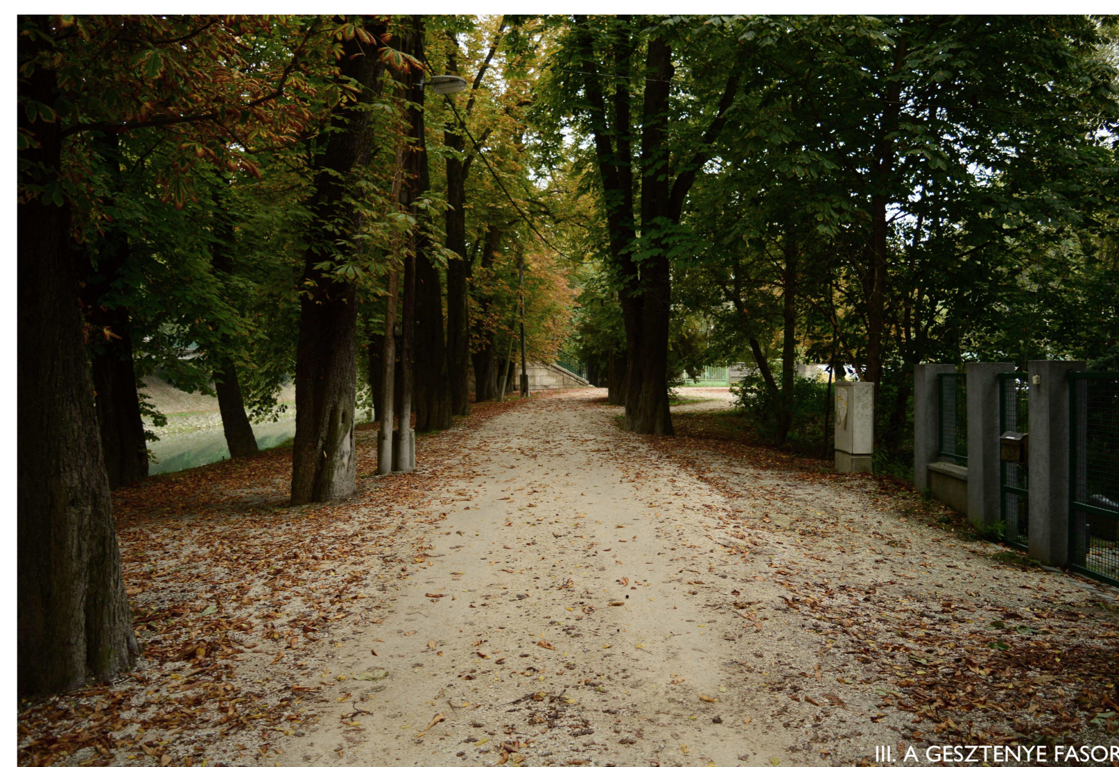
III. A GESZTENYE FASOR