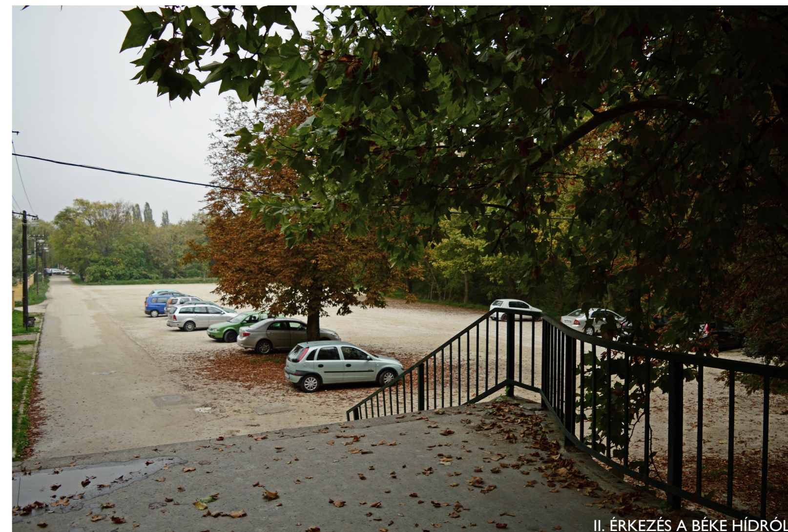
II. ÉRKEZÉS A BÉKE HÍDRÓL