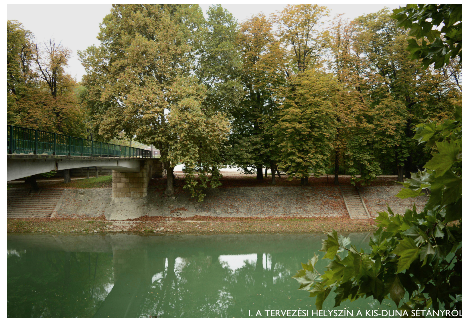
I. A TERVEZÉSI HELYSZÍN A KIS-DUNA SÉTÁNYRÓL

A központ teljes egészében megfelel az országban működő kerékpárosbarát szolgáltatói hálózat előírásainak, ezzel próbálva megfelelni az Esztergomba látogató kerékpárosok minél szélesebb körű igényeinek. A „U” alakot formáló épülettömeg homlokzatát változó panelezéssel fémburkolat fedi grafitzürke színben. A sötét árnyalat kellemes kontrasztot teremt a természet színeivel, a gesztenyefák és a Kis-Duna vízének zöldjével, nem válik hivalkodóvá, érvényesülni enged a hely szépségét. A változó paneleméret pedig - mindamellett, hogy dinamikusságot sugall -, a nagy felületeket oldja ezzel az apró részletekkel teli környezetben. A ház által körbeélt belső udvar felé barátságos faburkolat váltja a hideg fémeket, a védelmet nyújtó előtetők alatt. A központban zajló élet fő közlekedési útvonalát végigkísérő anyag egy saját, bensőséges világot teremt az ide betérők számára. A két jól elkülönülő anyag és a biciklis világ hangulatának összekapcsolásáról a nyílászárók bordó színű tokjai gondoskodnak. A környezetet zöldjének komplementerékként működő meleg szín mellett, hogy a ház barátságos hangulatát erősíti, a sötétzürke felületeken hívogatóan jelenik meg az erre járók számára. Ugyancsak fontos elemként jelennek meg a nyílászárók nagy üvegfelületeit felosztó árnyékolók. Működésük során, élénk színűnek köszönhetően életre kelnek a homlokzatot, ezzel egy folyamatosan változó, újabb és újabb arcát mutatva a háznak.