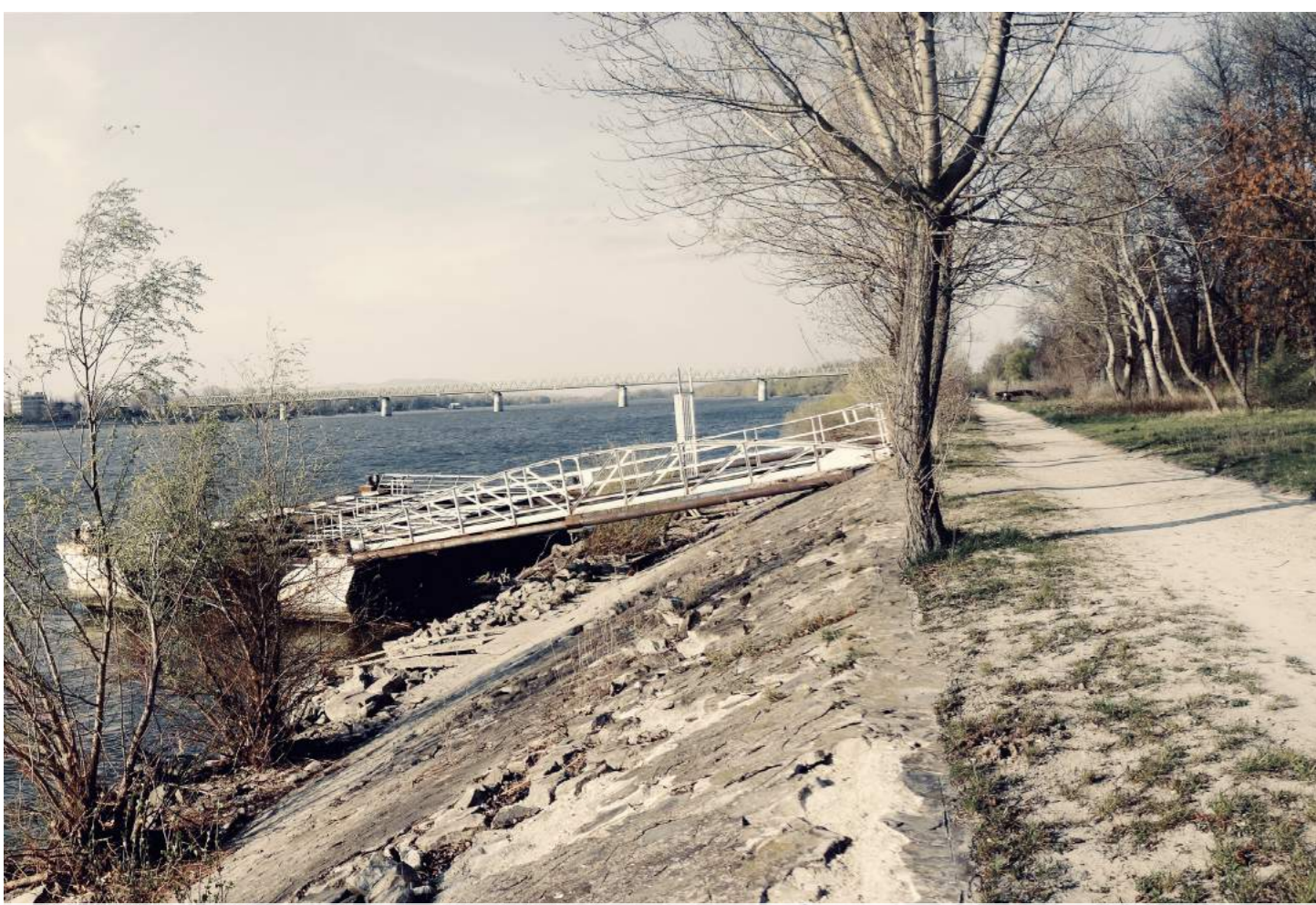
rendezetlen parti sáv, elhanyagolt növényzet, rossz állagú partfal