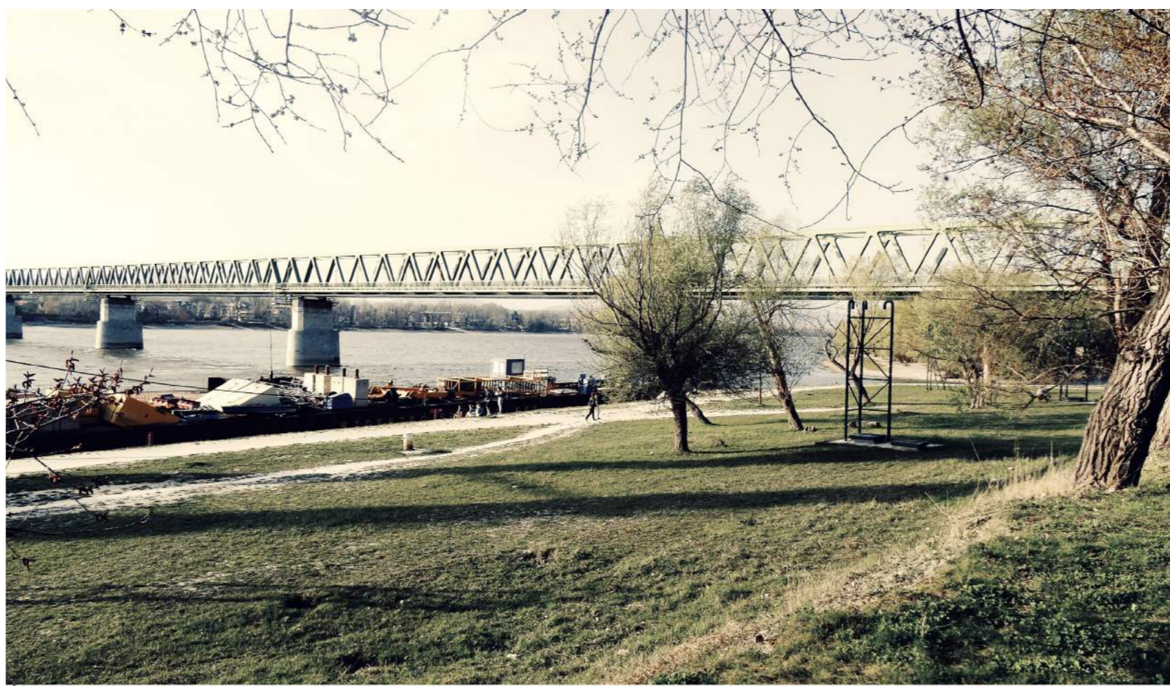
Ujpesti vasúti híd és környezete, északi "fogadótér"