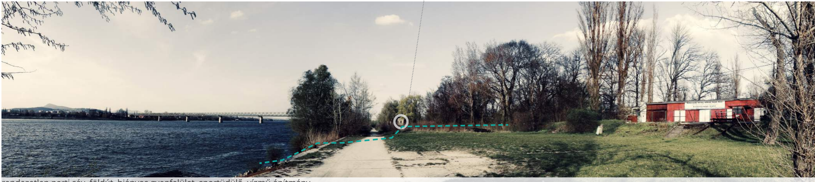
rendezetlen parti sáv, földút, hiányos gyepterület, sportuduló, vízmű építmény

A tervezési terület a félsziget Duna felőli, mintegy 1,5 km hosszú partszakasza, mely jelenleg közterületi sétányként funkcionál. A déli közmű-nyalagos hídtól az Újpesti vasúti hídig húzódik a terület XIII. kerületi része, magába foglalja a híd környezetét (XIII. és IV. kerület), területe összességében körülbelül 8,7 ha. A tervezendő terület Déltől Észak felé haladva növekvő szélességű, a Duna-parttól a telkek határáig tartó sávot tartalmazza. A kiépített partfal tetején vezető sétánytól 2-30 méterre a sziget belseje felé egy kb. 2 méter magas töltés húzódik a tervezési területen belül.