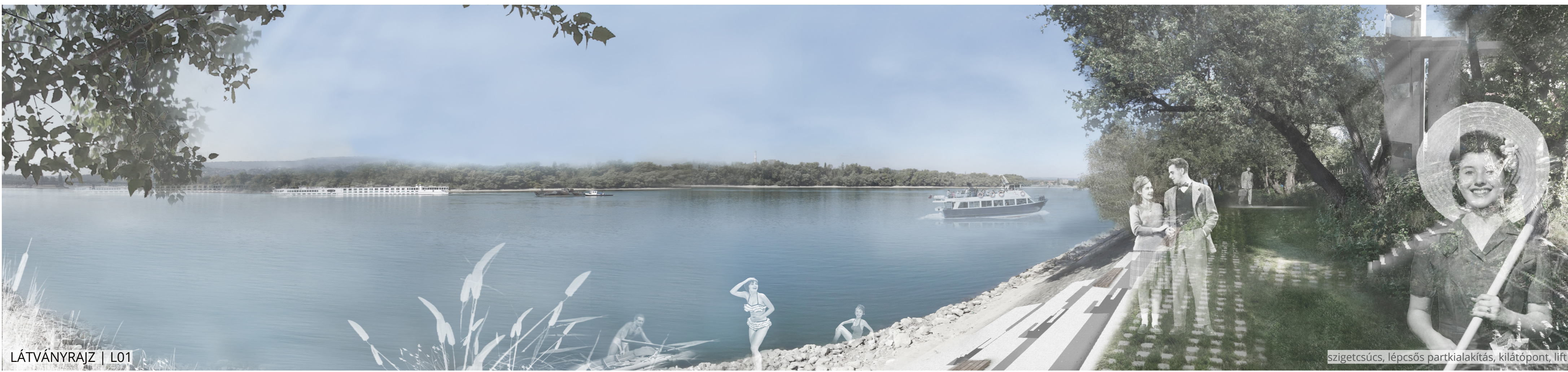
LÁTVÁNYRAJZ | L01