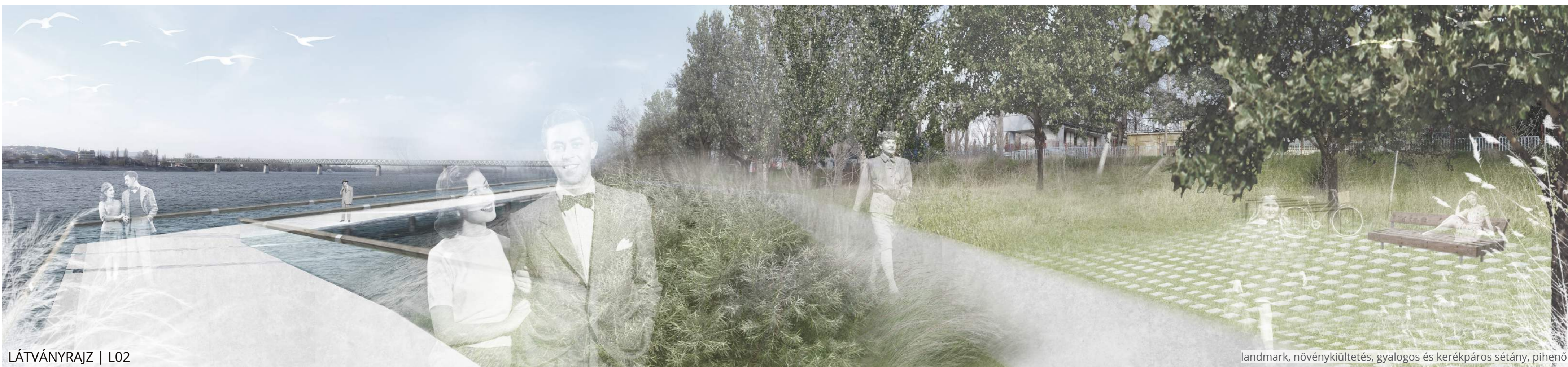
LÁTVÁNYRAJZ | L02