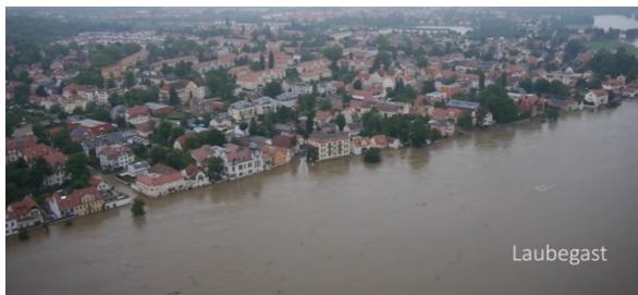
Dresden Hochwasser 2013 - Eine Stadt unter Wasser

Drezdában pontosan ugyanazt jelenti, mint Szegeden! Drezdai képek, mely Szegeden is készülhettek volna: