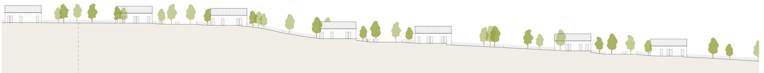
B-B METSZET M=1:500