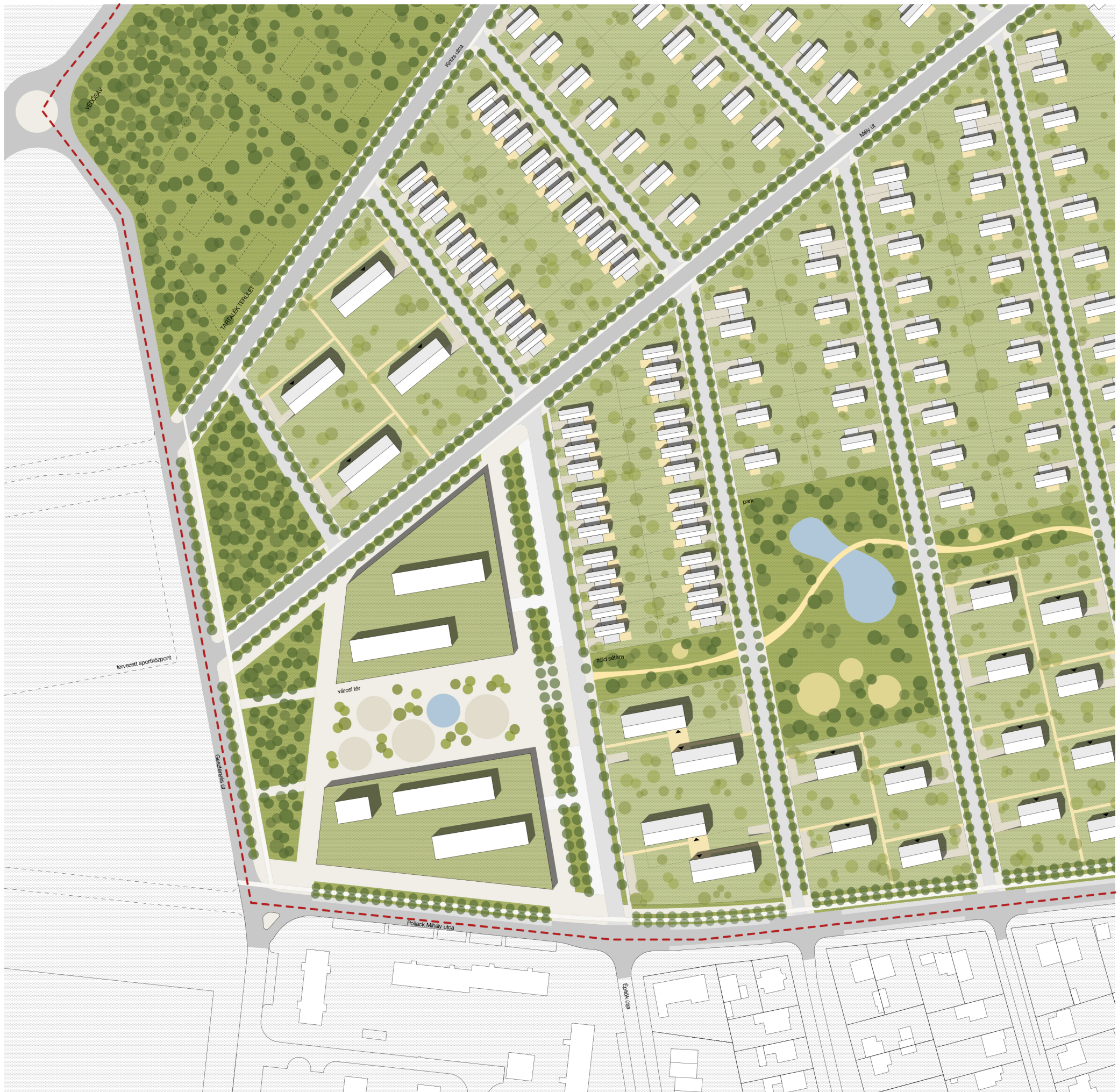
HELYSZÍNRAJZ A VÁROSKÖZPONTI TERÜLETRŐL M=1:1000