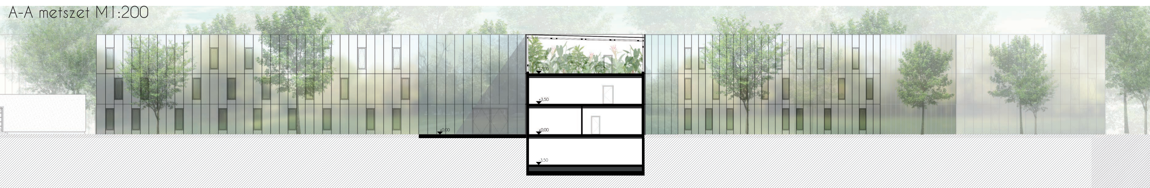
A-A metszet M1:200