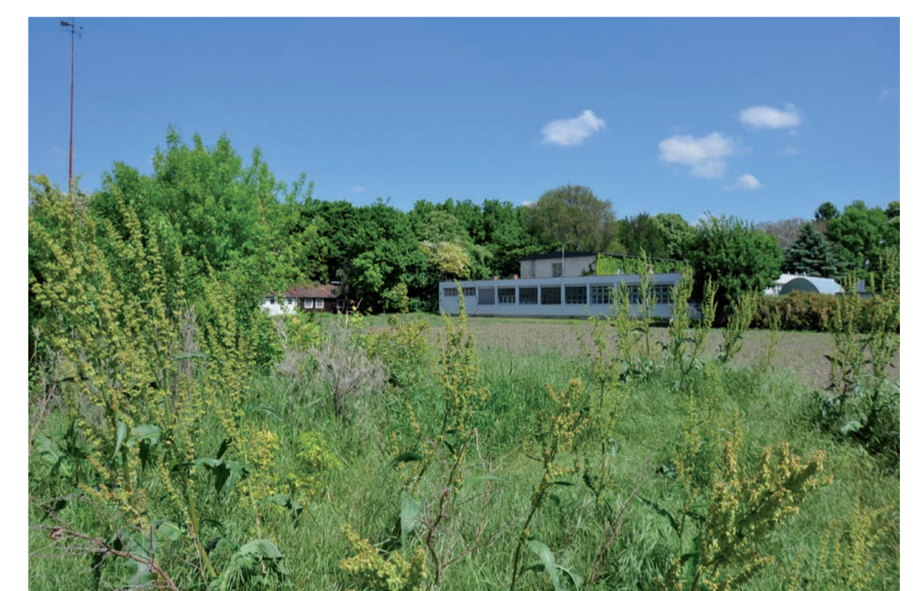
visszatükröződő helyszíni adottságok