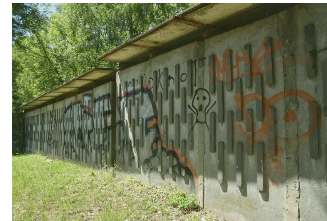
1 MEGLÉVŐ ÖLTÖZŐBLOKK TÉRFAL