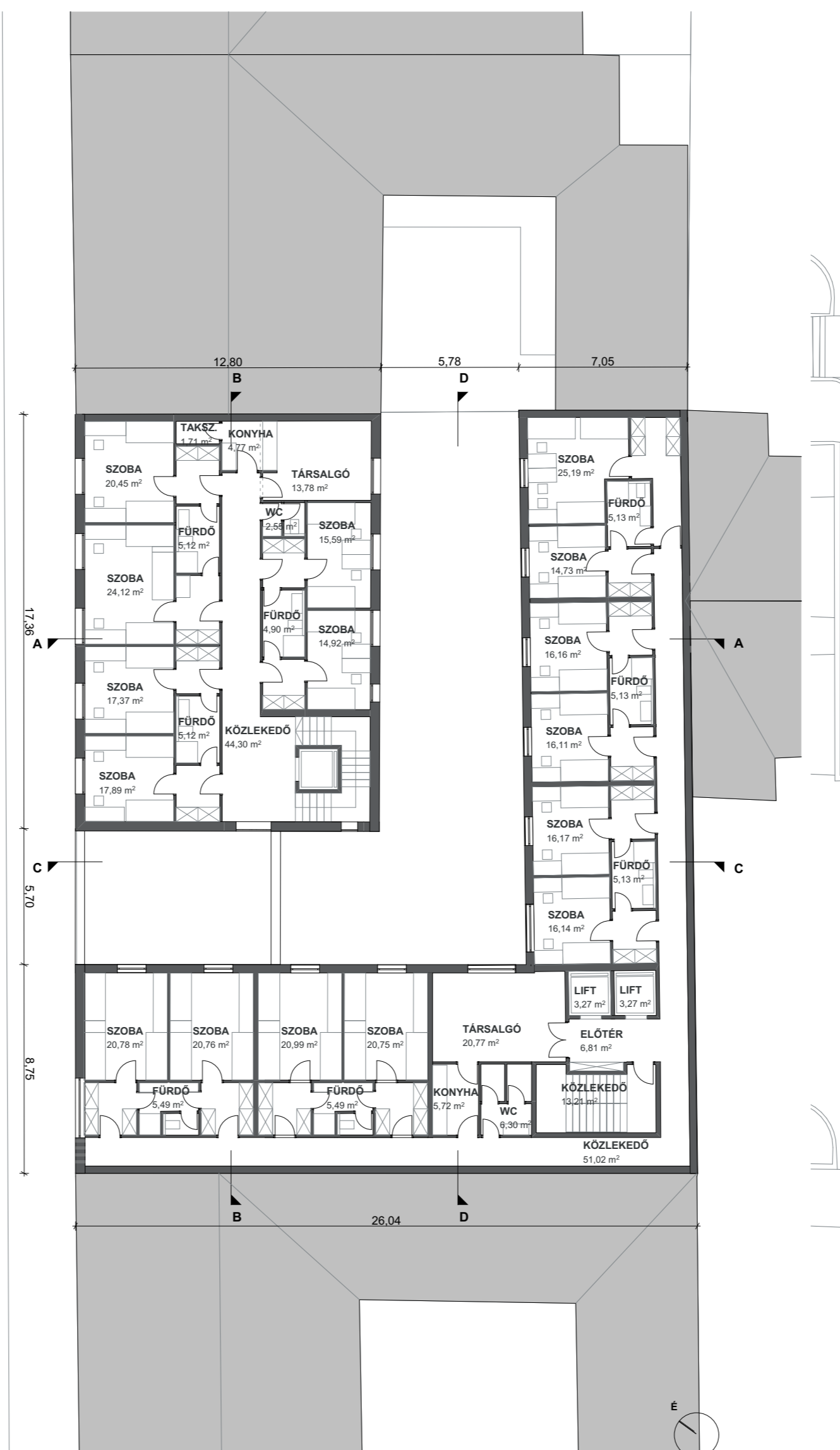
2. ÉS 3. EMELETI ALAPRAJZ M 1:200