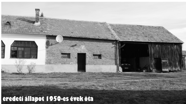
eredeti állapot 1950-es évek óta