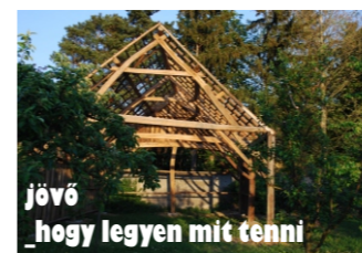
jövő hogyan legyen mit tenni