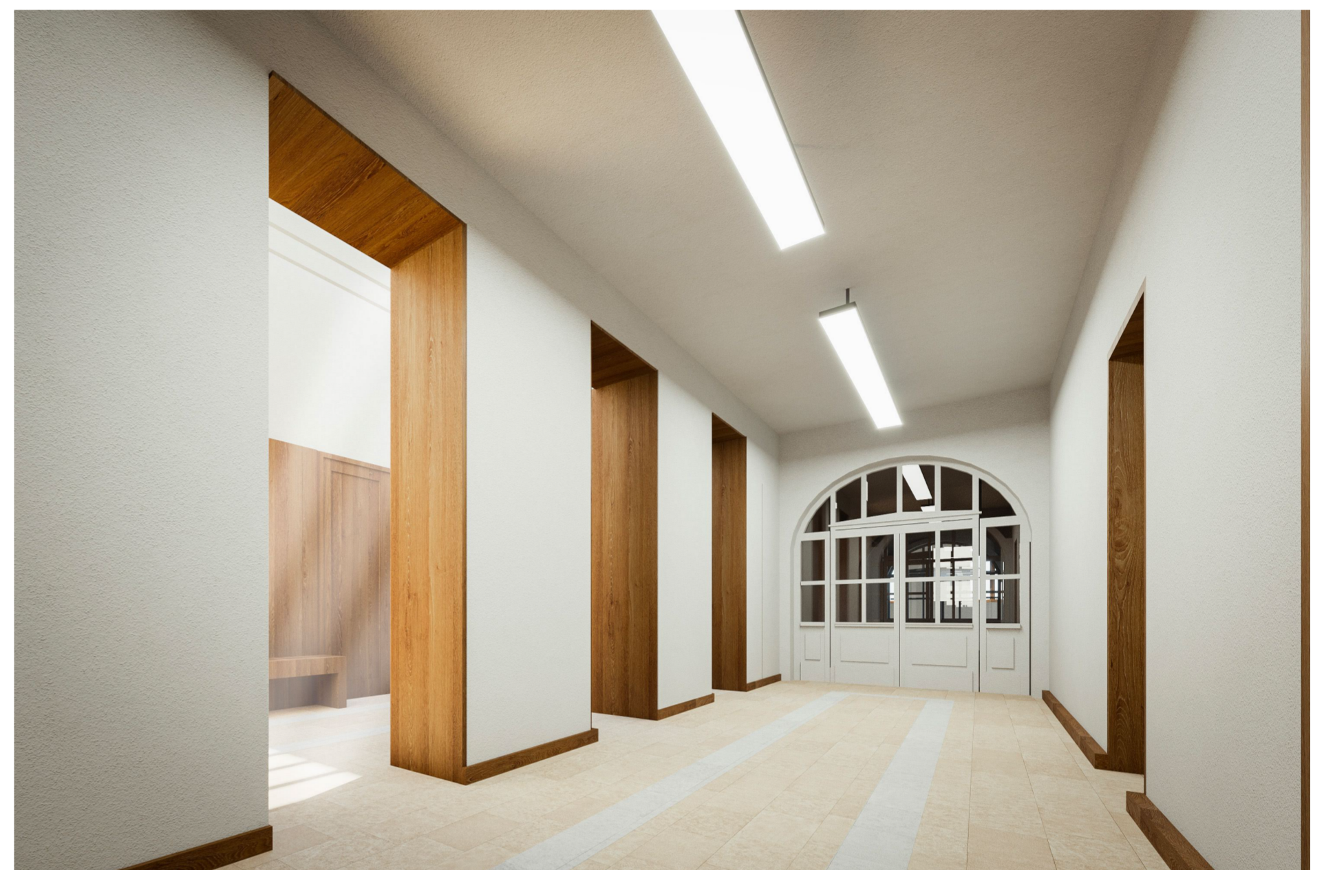
Belső folyosó és előcsarnok látványterve