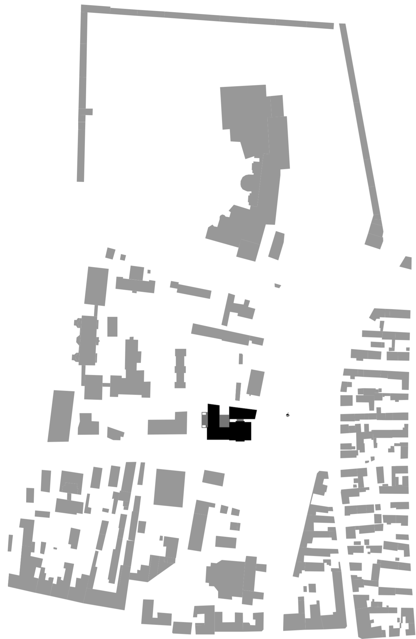
Helyszínrajz M 1:2000