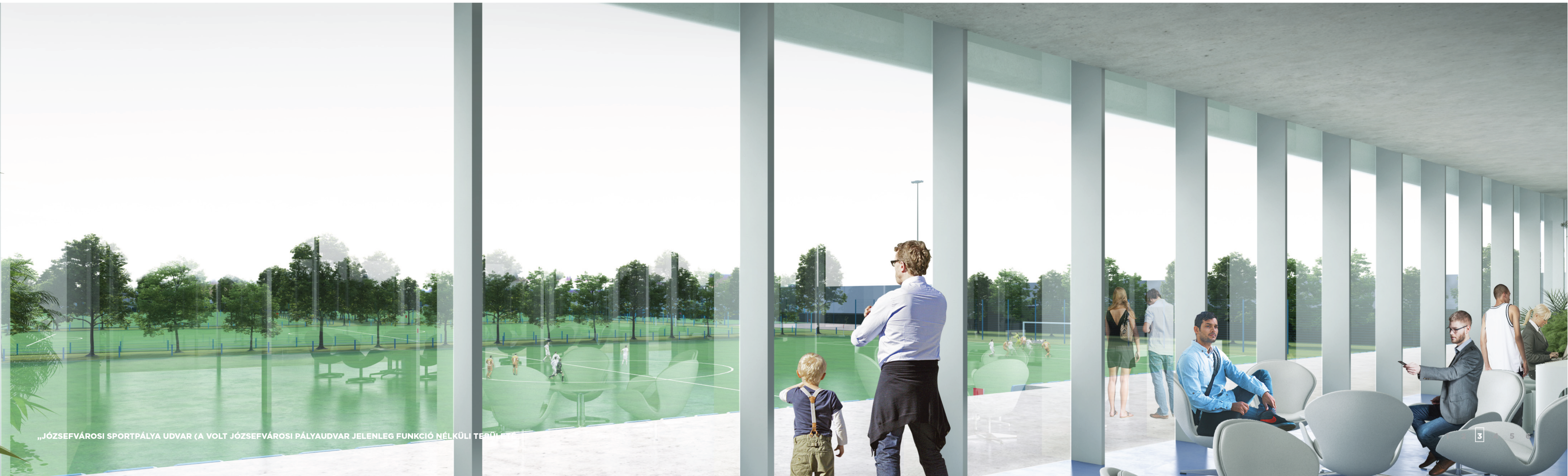
„JÓZSEFVÁROSI SPORTPÁLYA UDVAR (A VOLT JÓZSEFVÁROSI PÁLYAUDVAR JELENLEG FUNKCIÓ NÉLKÜLI TERÜLET)

A lelátóként képzett alsó tömeg felső szintjén az épület tömegébe integrálva a vendégek számára elérhető vizesblokkok vannak, mellettük flexibilisen hasznosítható területekkel (Maccabi Játékok idejére kiszolgáló funkcióknak). A lelátóra érkező közönség útvonala nem keresztezi ajátékosok illetve az akadémiák útvonalát, melyek az épület két végén tudnak kijutni a hátsó pályákhoz, az épület közepén pedig a centerpályához.