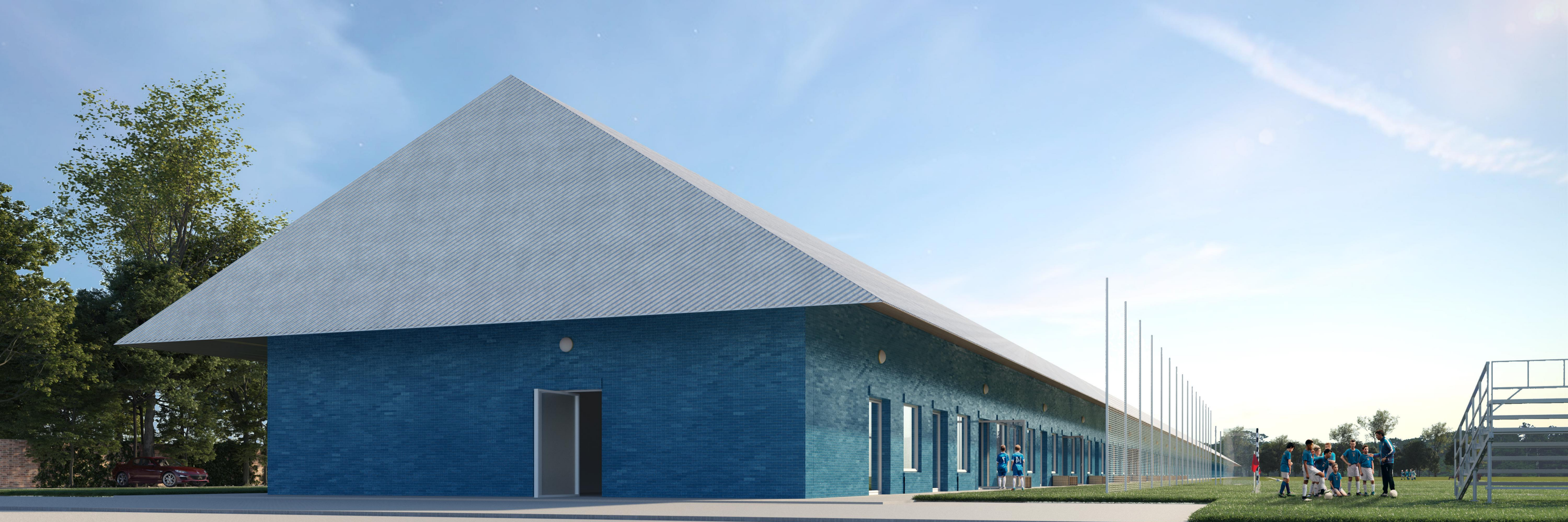
Látványterv a bejárati kapu irányából