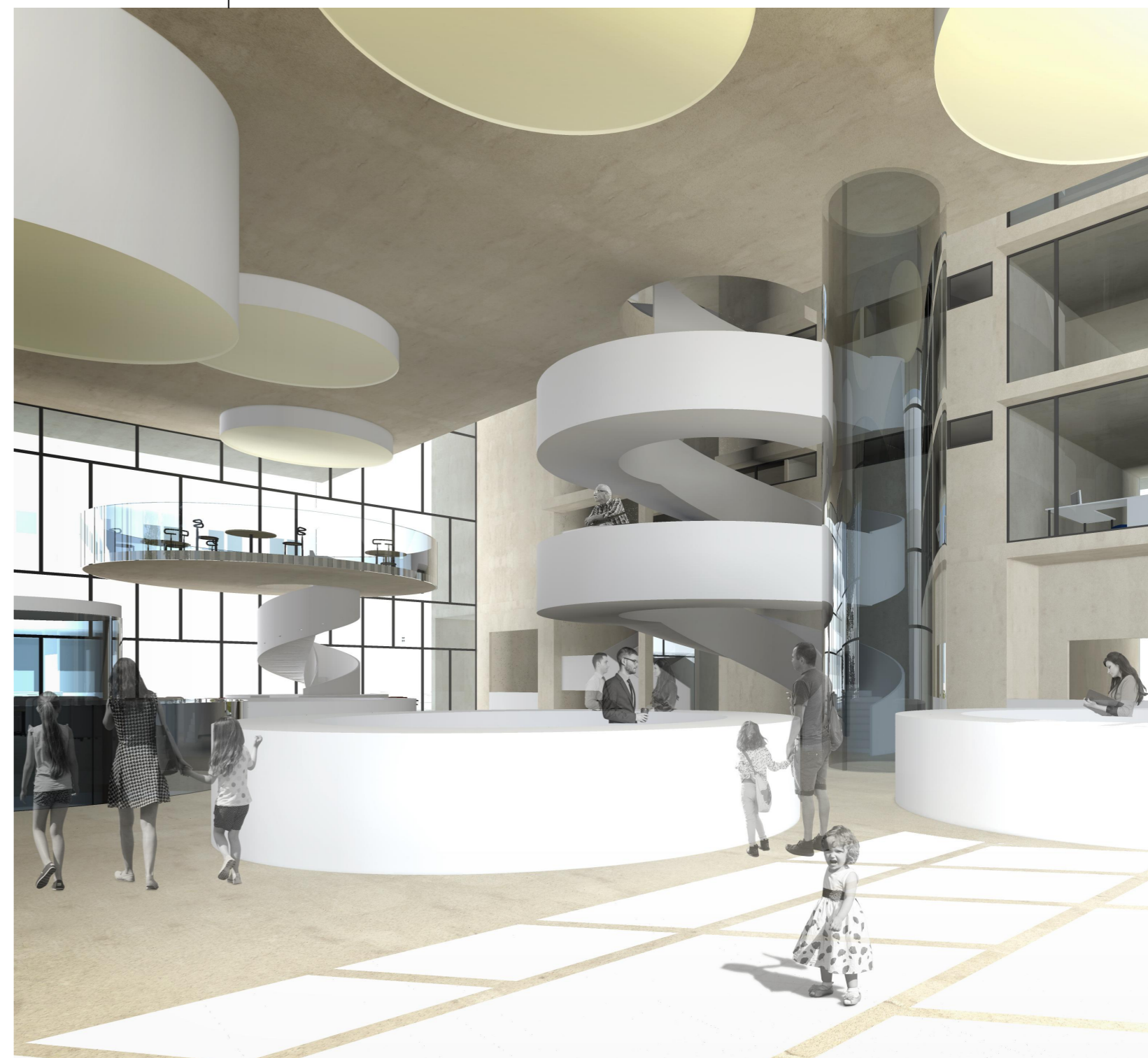
Könyvtár és tudásközpont építészeti megfogalmazása - 2018