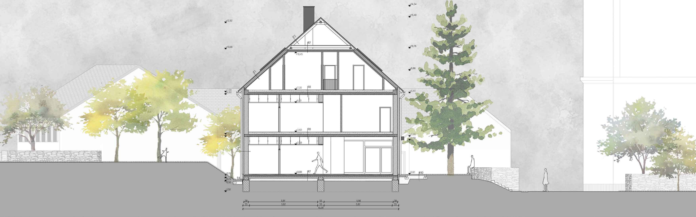
E-E METSZET M1:100