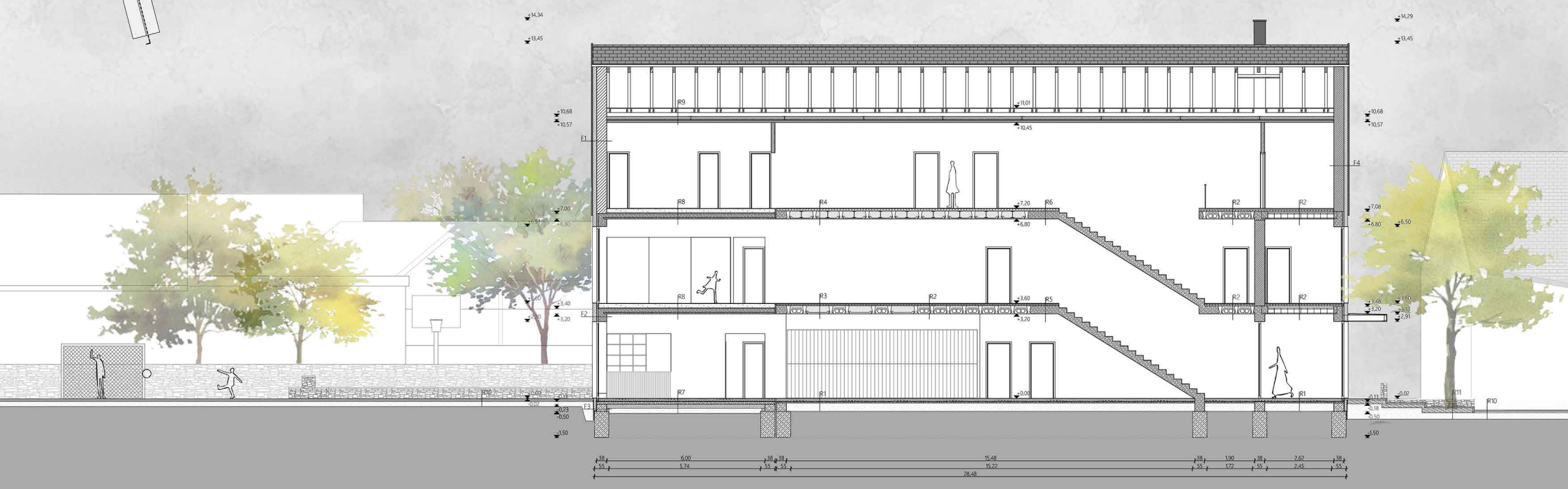
D-D METSZET M1:100