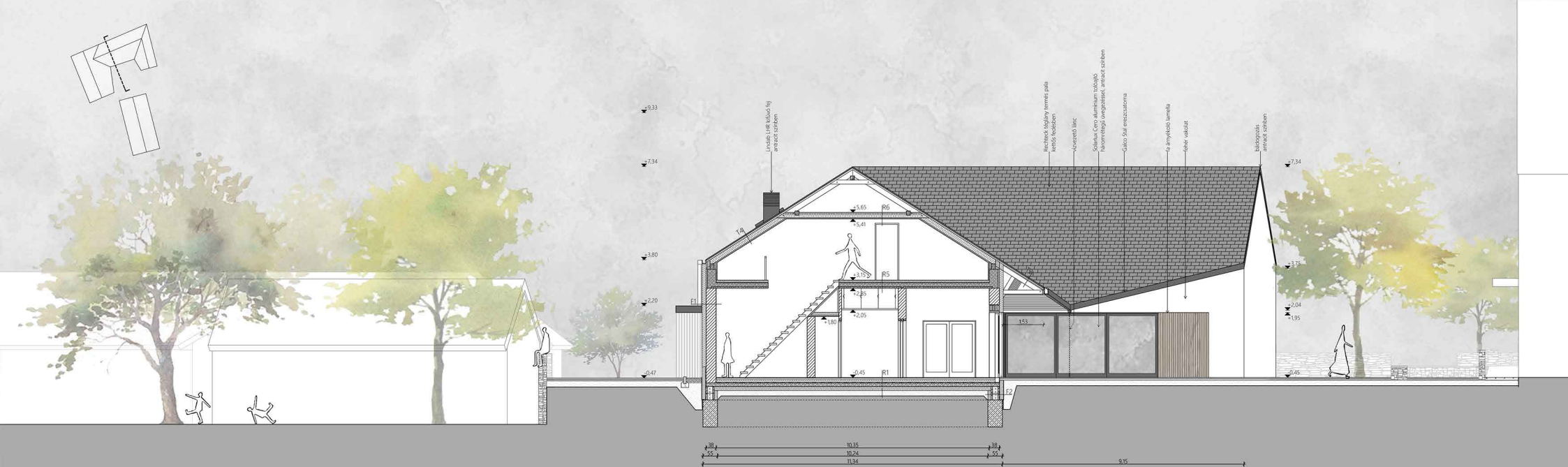
C-C METSZET M1:100