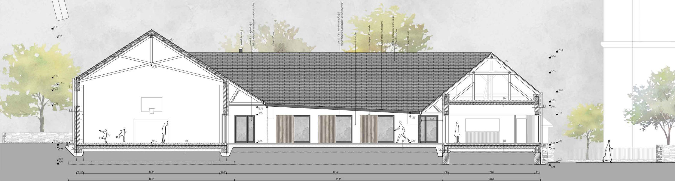
A-A METSZET M1:100