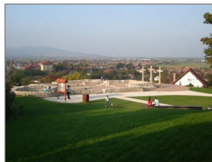
A kálvária a 2011-es feltárás idejében és napjainkban