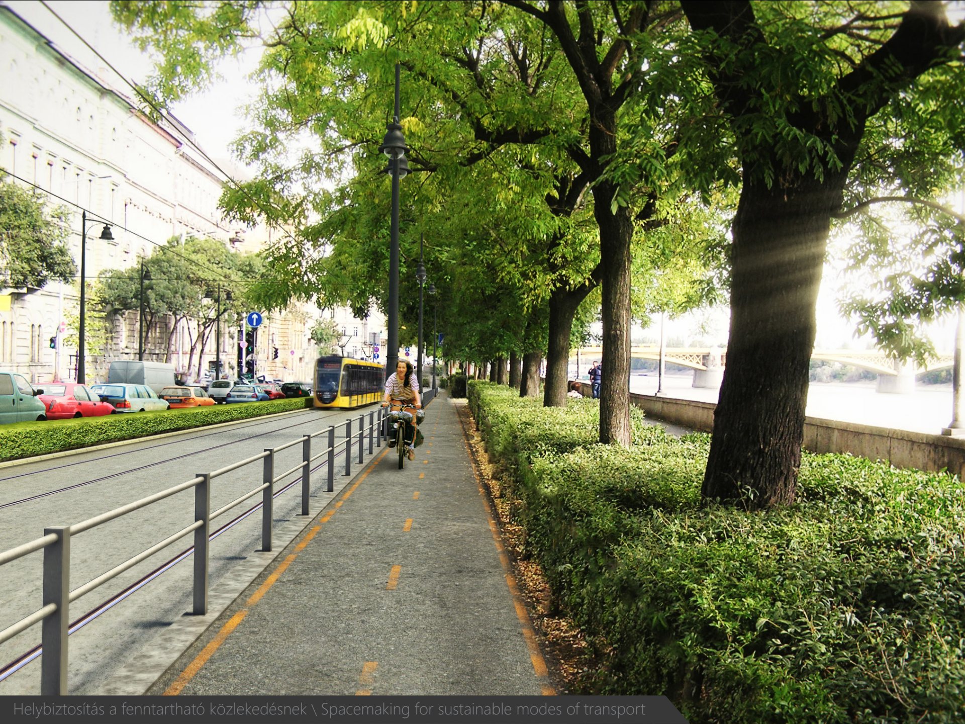
Helybiztosítás a fenntartható közlekedésnek \ Spacemaking for sustainable modes of transport