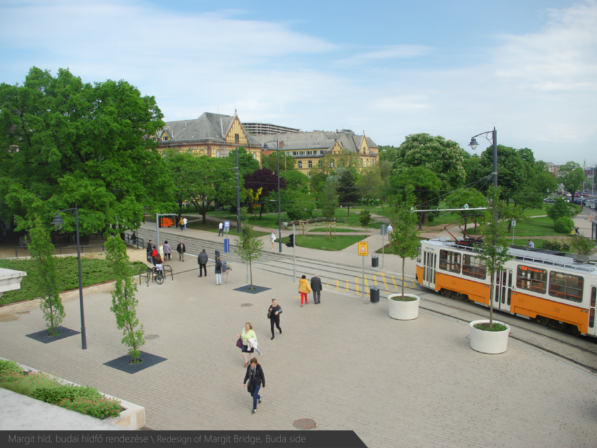
Margit híd, budai hídfő rendezése \ Redesign of Margit Bridge, Buda side