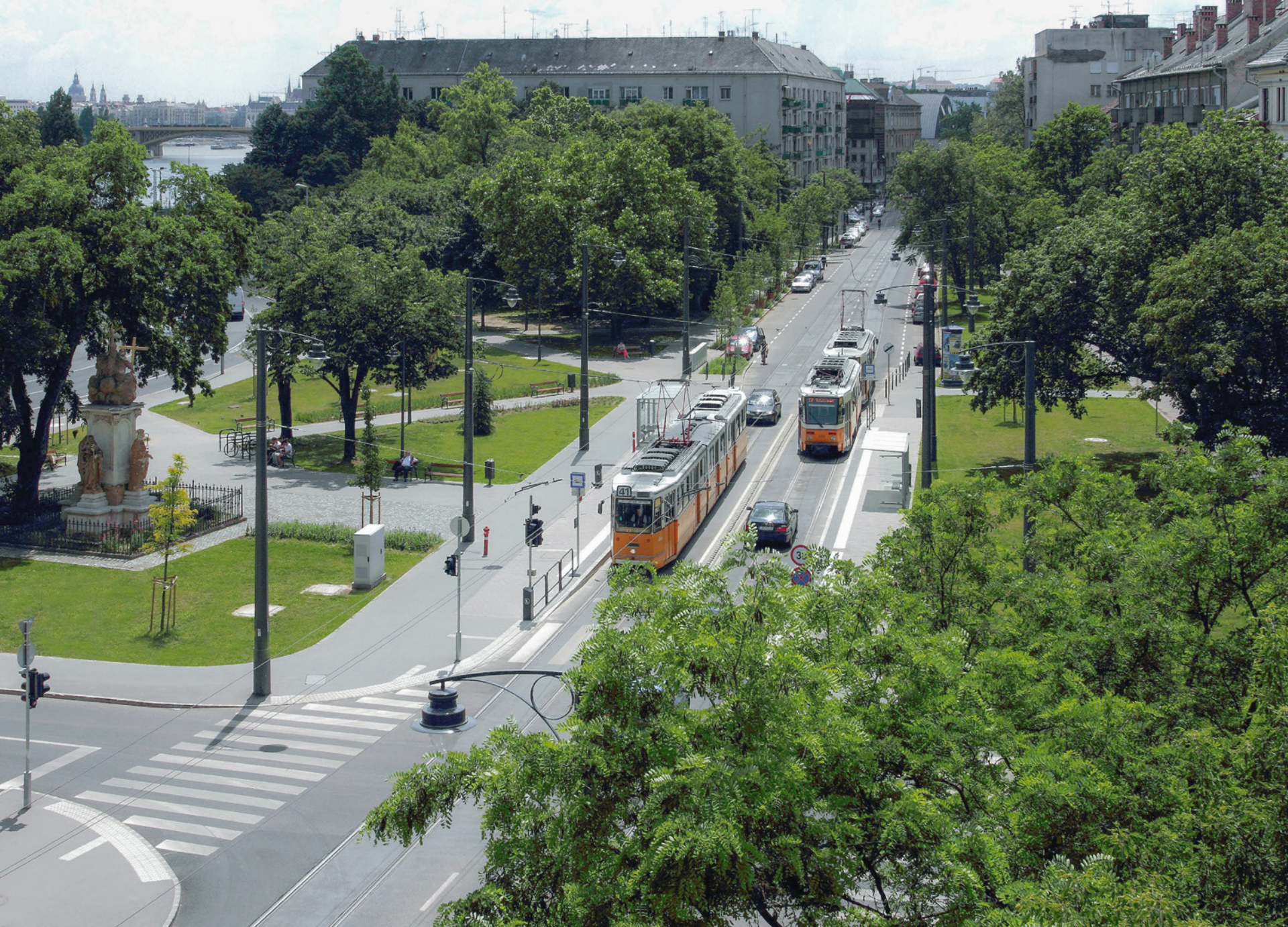
Megújult Zsigmond tér \ Regeneration of Zsigmond square