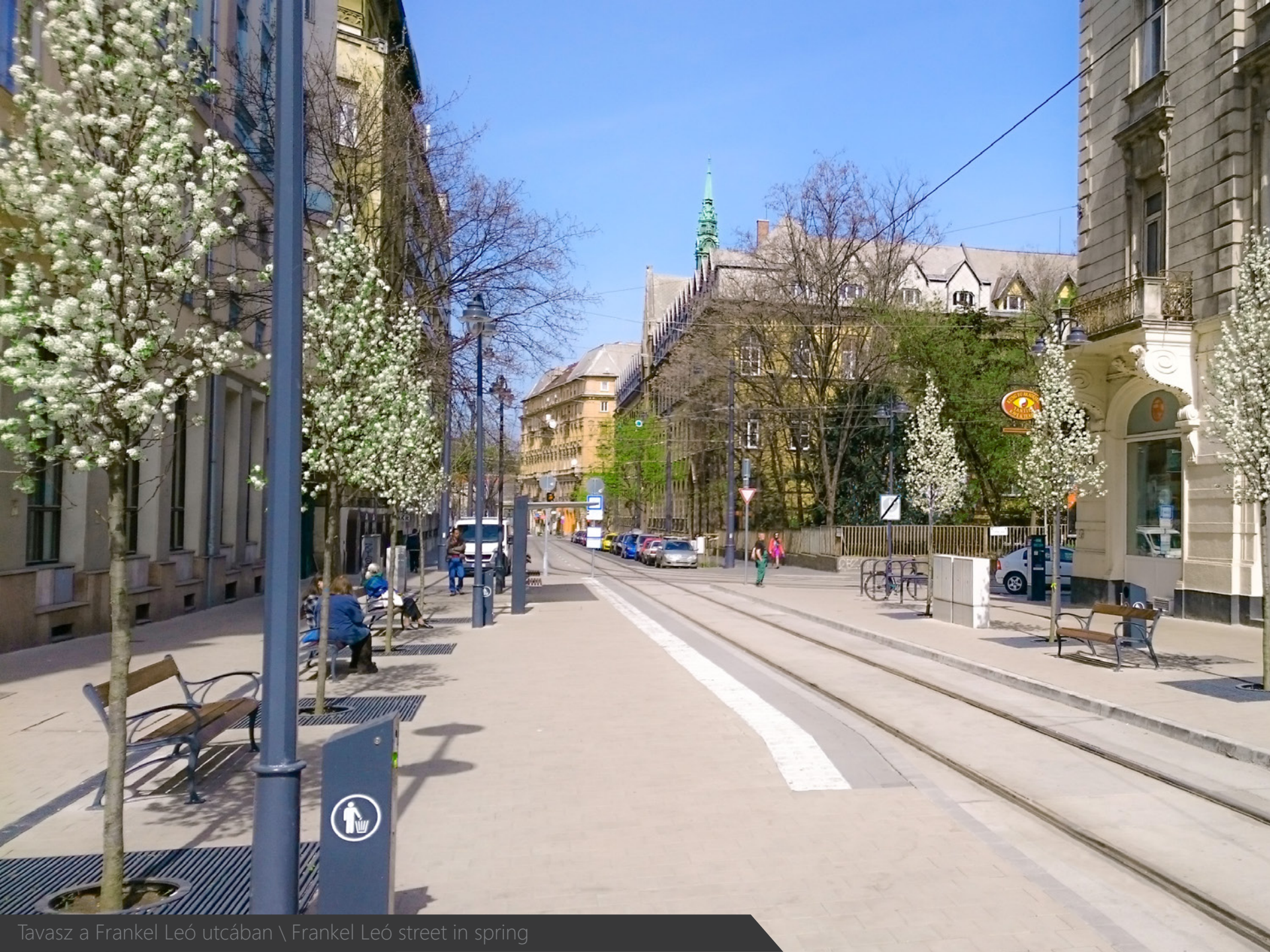
Tavaszi a Frankel Leó utcában \ Frankel Leó street in spring