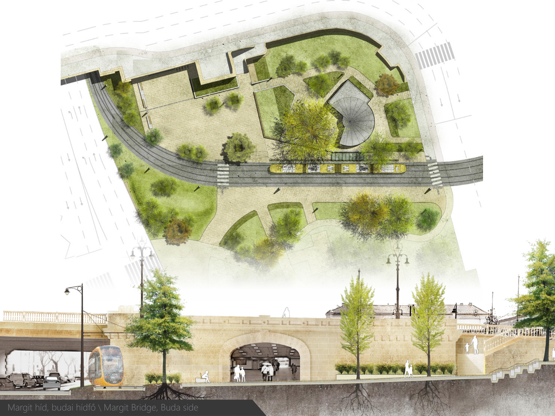
Margit híd, budai hídfő \ Margit Bridge, Buda side