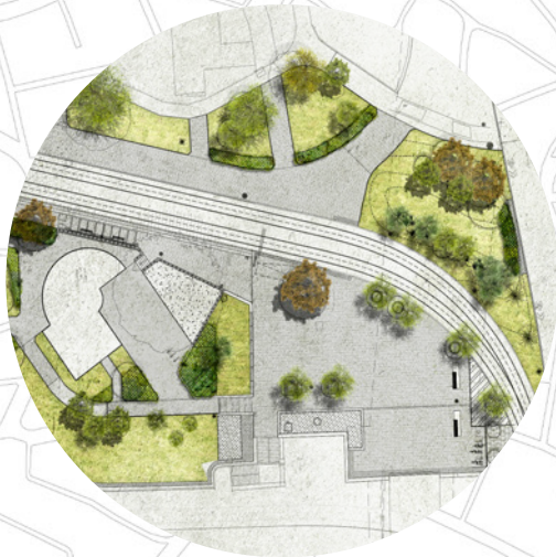
Margit híd, budai hídfő