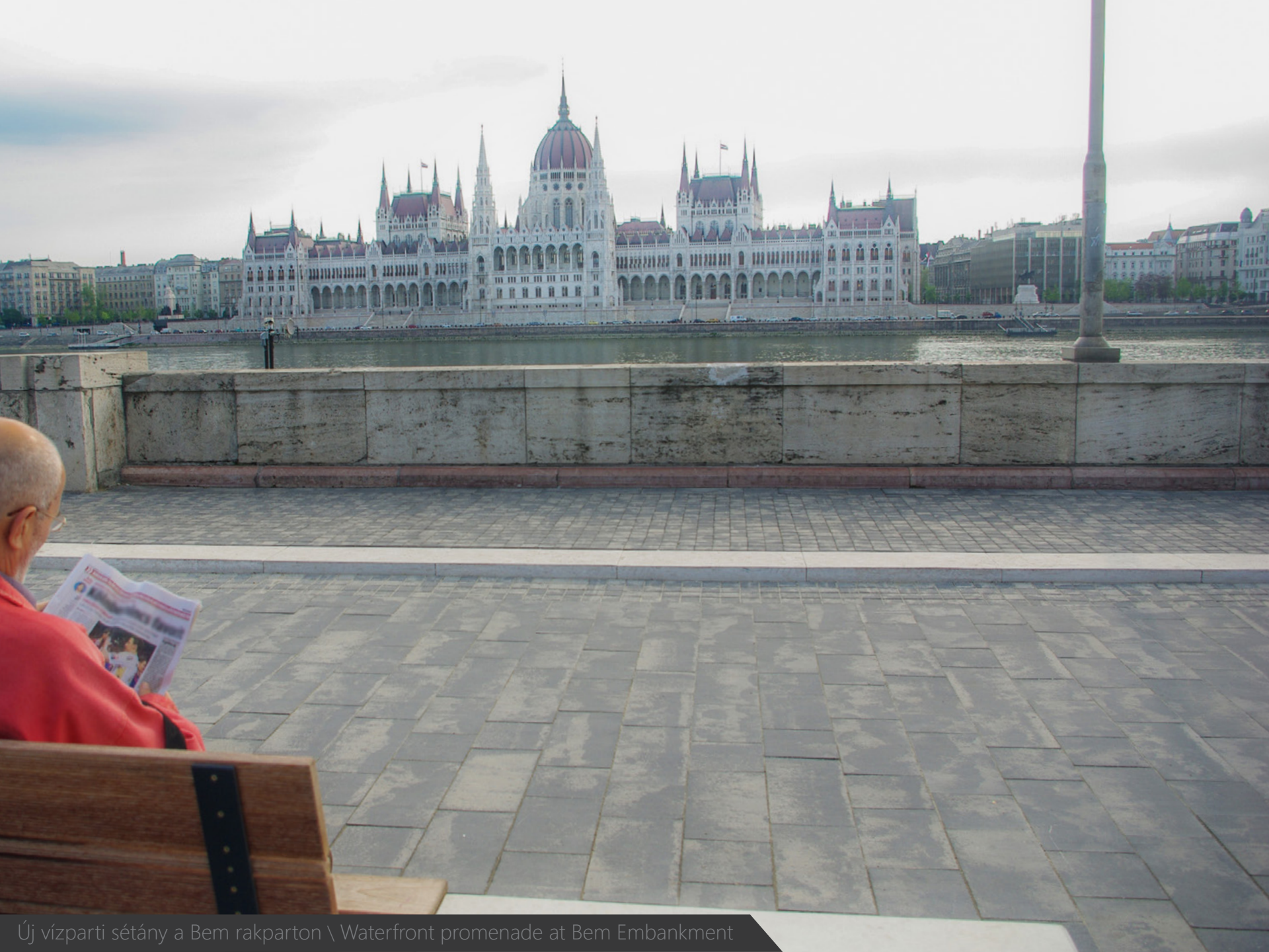
Új vízparti sétány a Bem rakparton \ Waterfront promenade at Bem Embankment