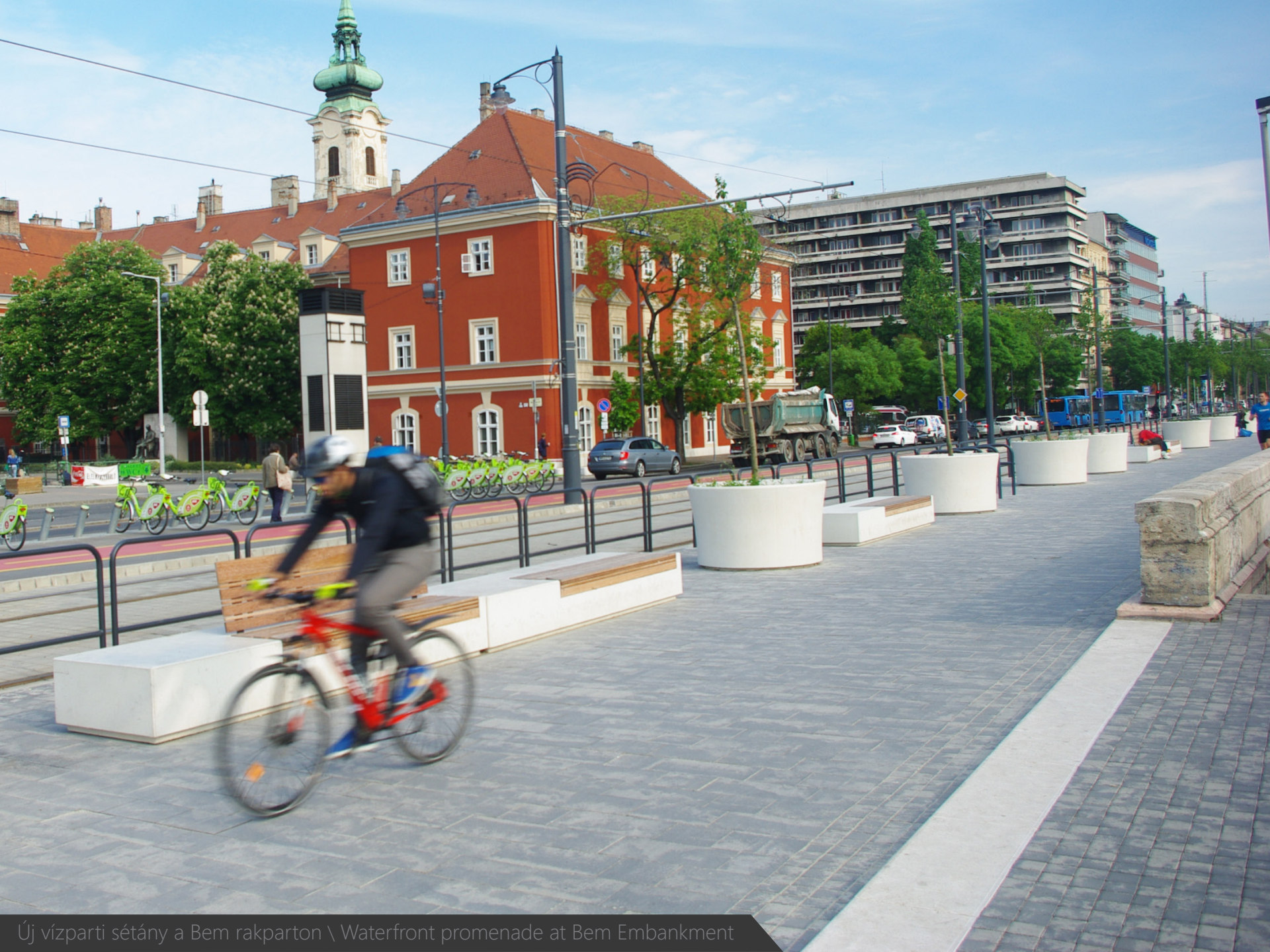
Új vízparti sétány a Bem rakparton \ Waterfront promenade at Bem Embankment