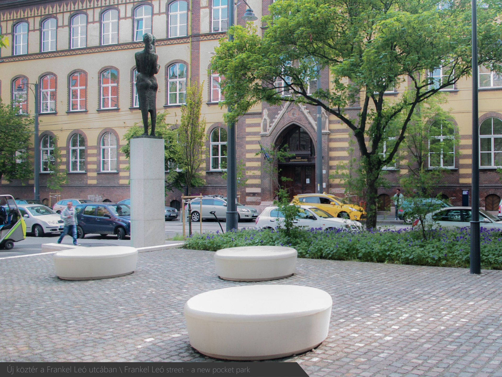
Új köztér a Frankel Leo utcában \ Frankel Leó street - a new pocket park