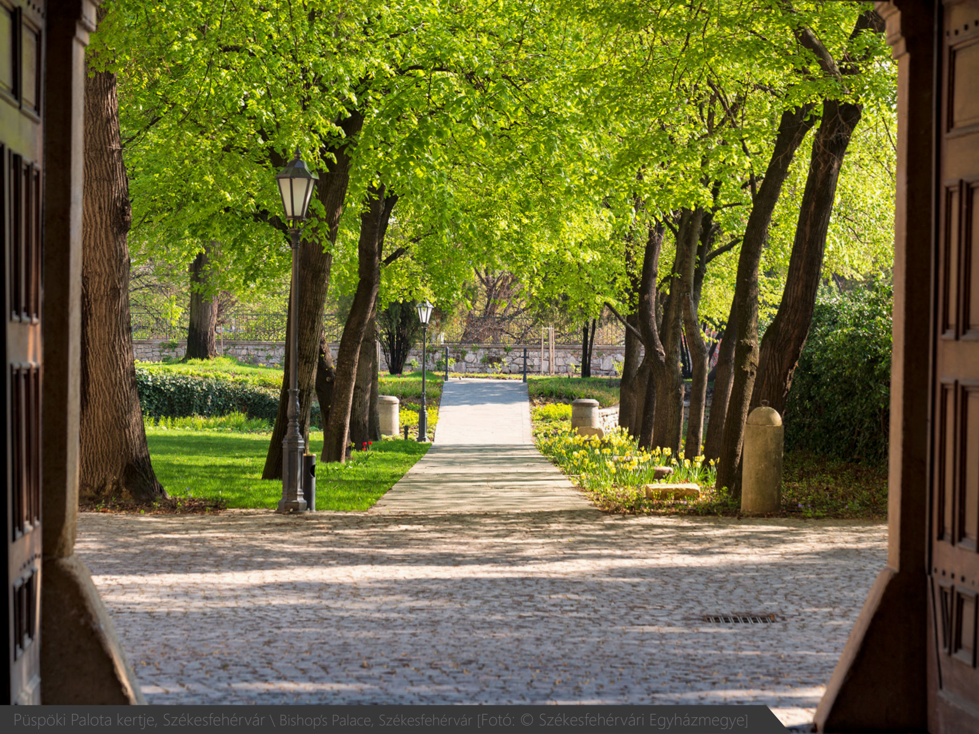
Püspöki Palota kertje, Székesfehérvár \ Bishop's Palace, Székesfehérvár