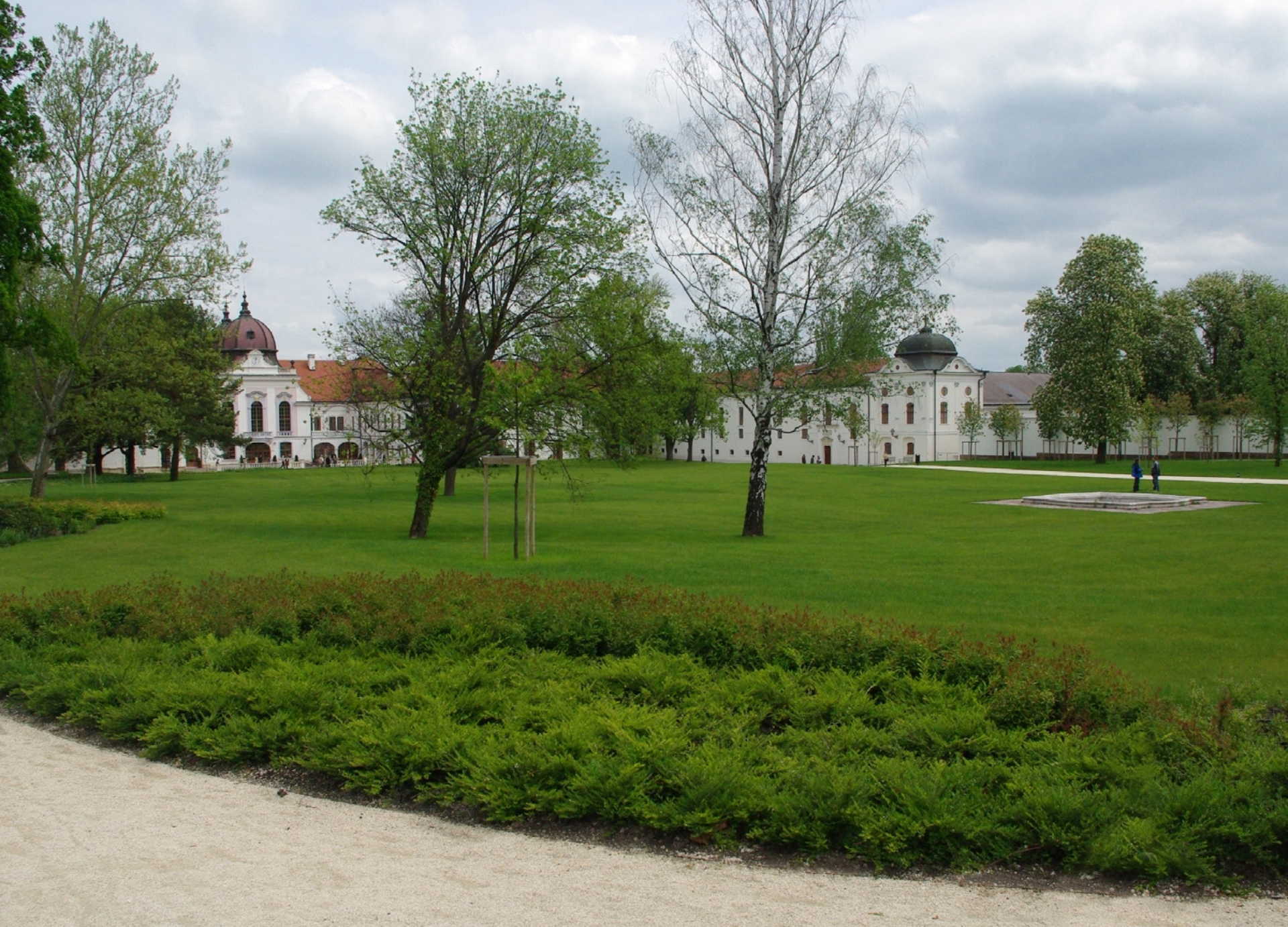
Gödöllői Királyi Kastély felső kertje \ Upper gardens of Gödöllő Royal Palace