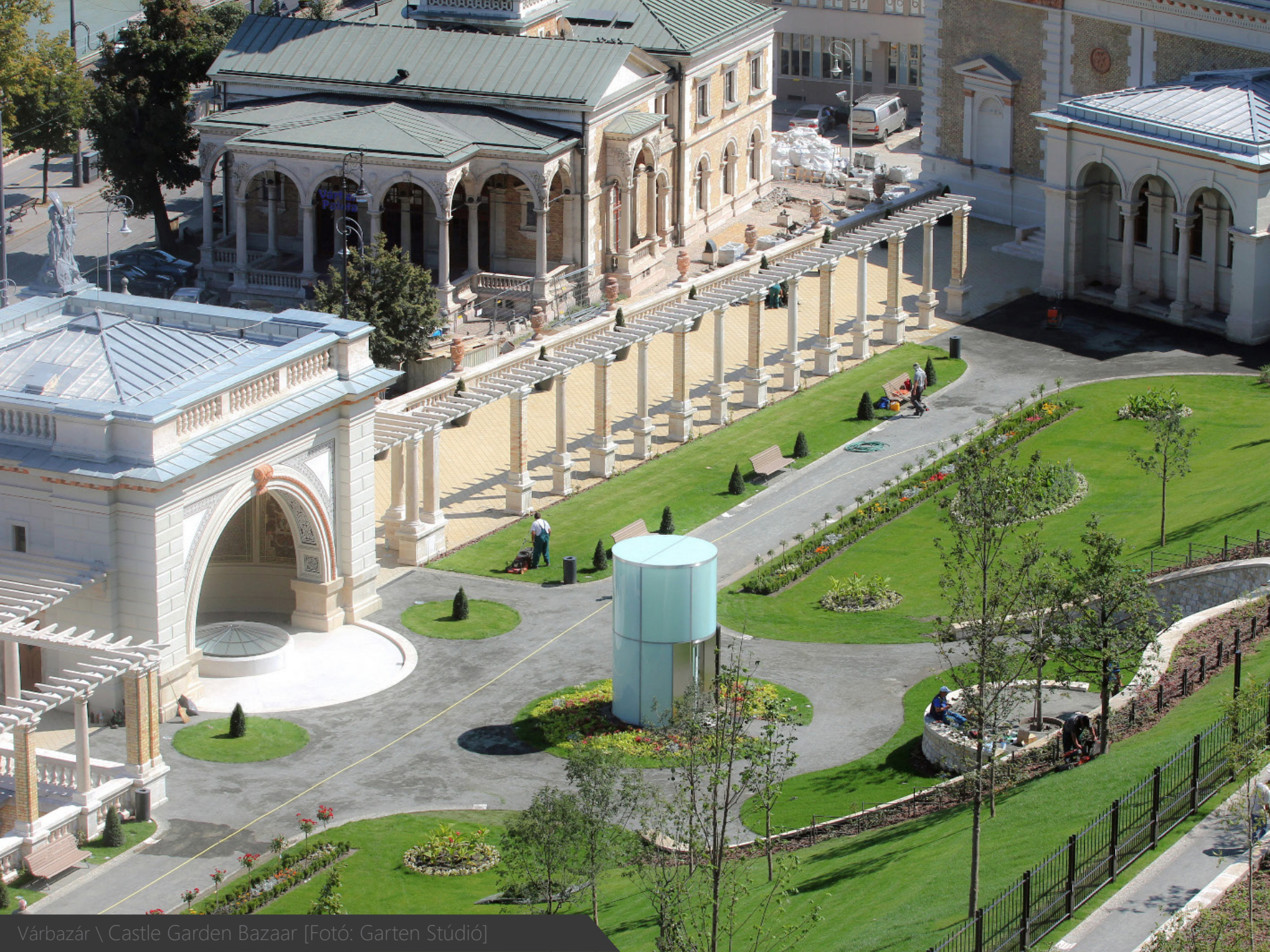
Várbazár \ Castle Garden Bazaar