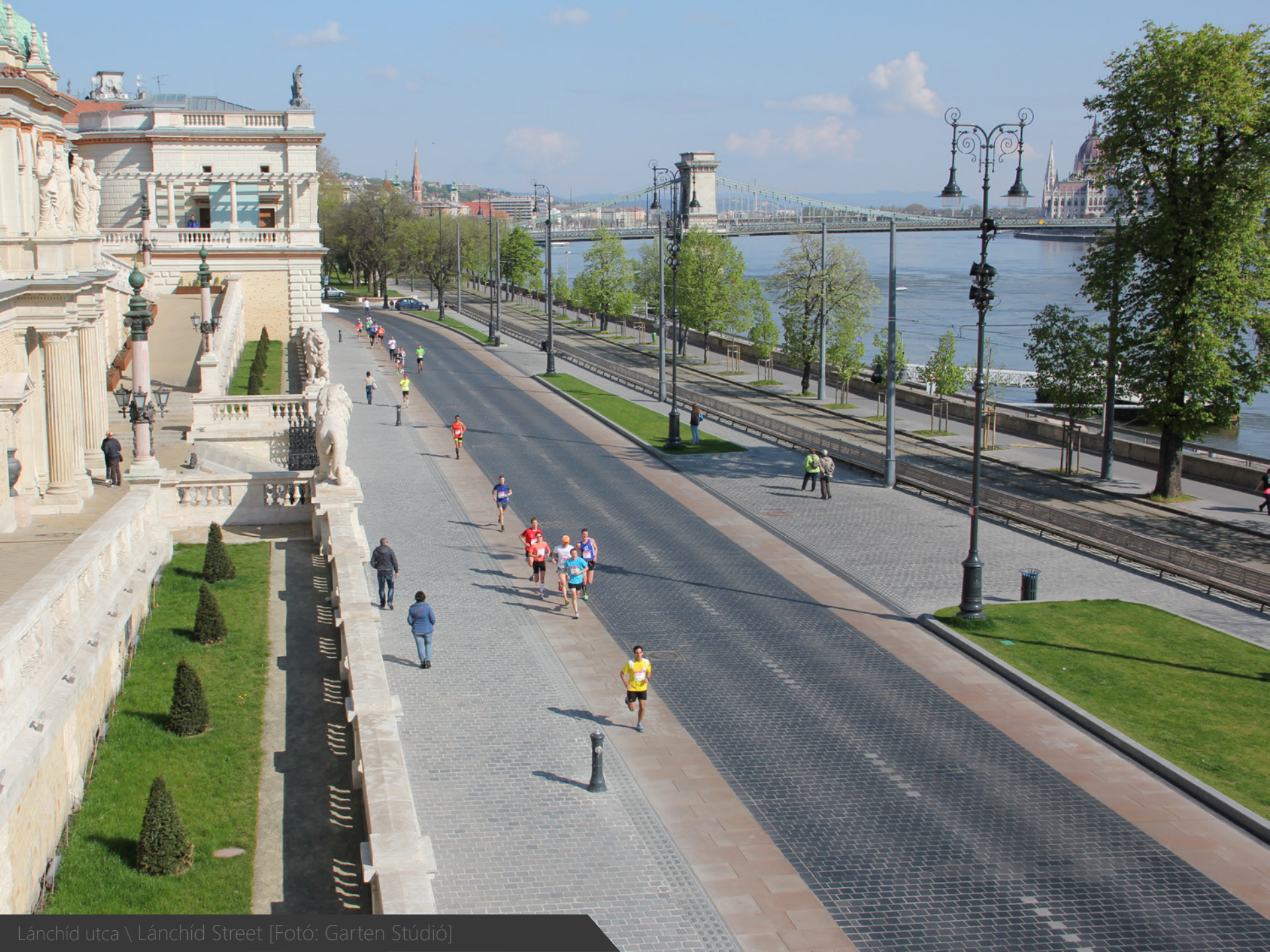
Lánchíd utca \ Lánchíd Street