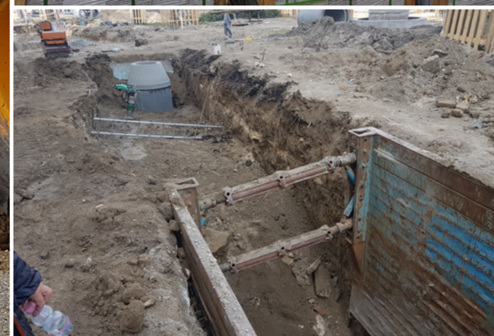
Nemzeti Múzeum kertje \ Garden of National Museum