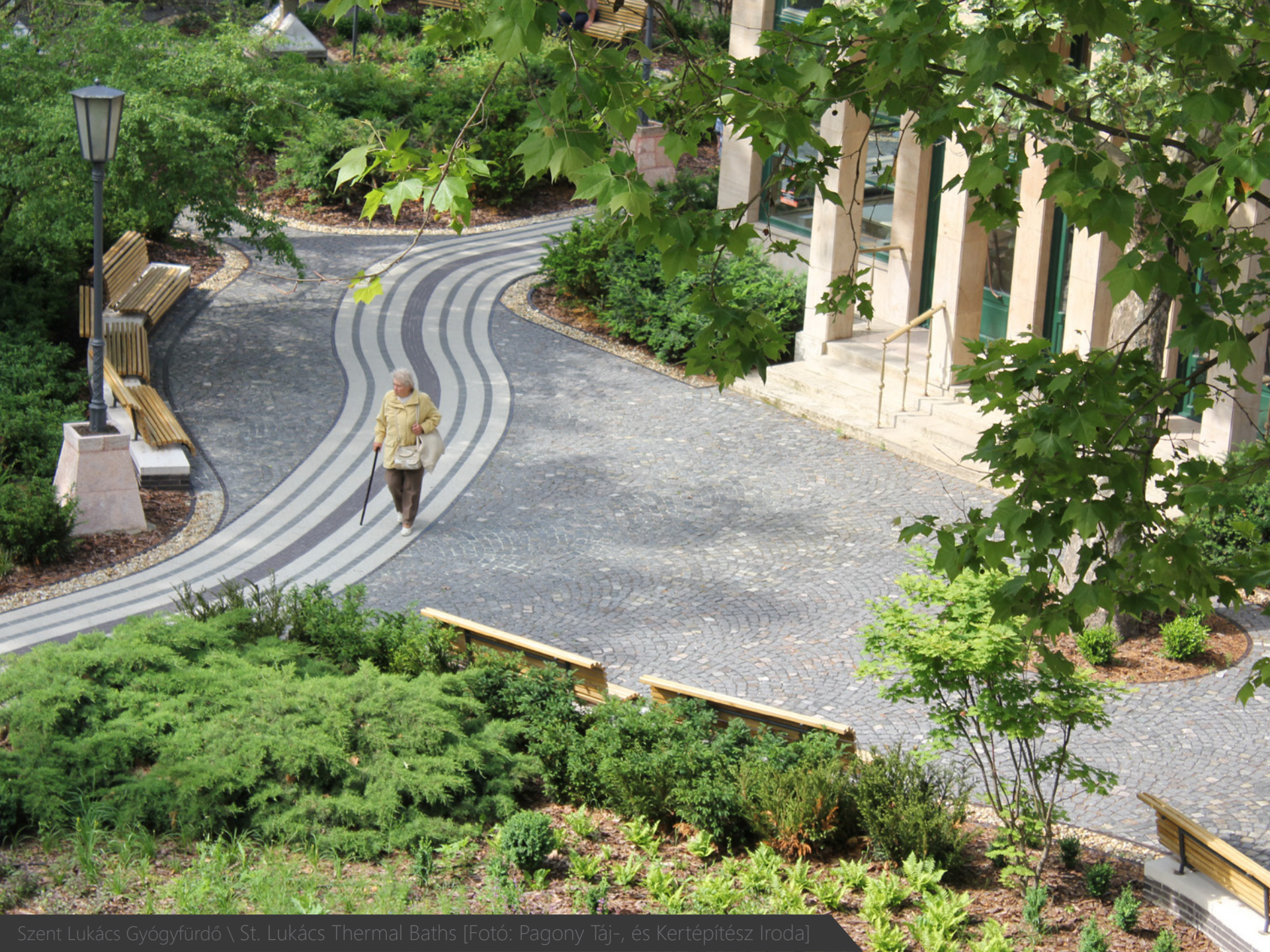
Szent Lukács Gyógyfürdő \ St. Lukács Thermal Baths